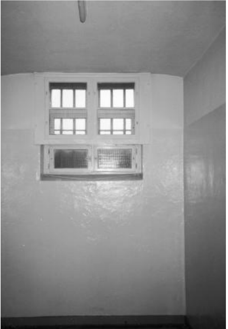
Schwerin, Gefängnis am Demmlerplatz, Zelle 54