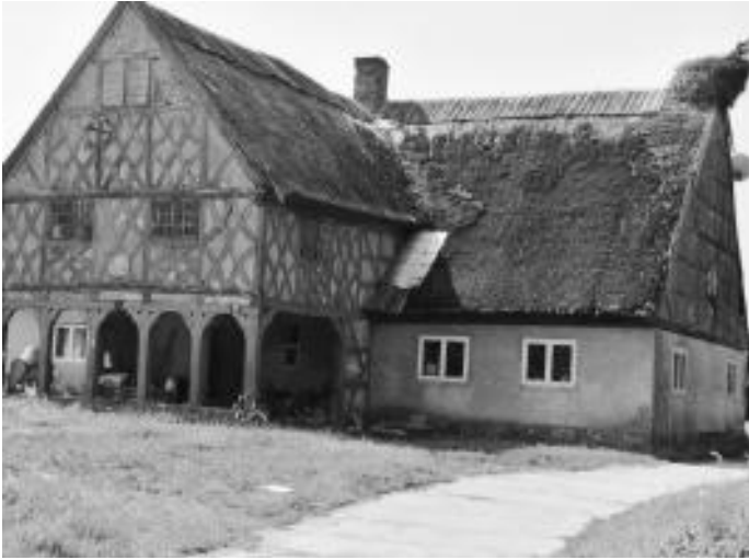
Vorlaubenhaus auf der Elbinger Höhe

Kempowski, der unter der Aufsicht des Pastors stand, unterrichtete die Kinder in seinem Vorlaubenhaus, im Sommer 15 Stunden pro Woche, im Winter 30. Er bekam nur noch 18 Taler Gehalt, kaum mehr als ein Knecht verdiente. Die Verschlechterung spricht für einen unrühmlichen Abgang von seiner ersten Stelle.