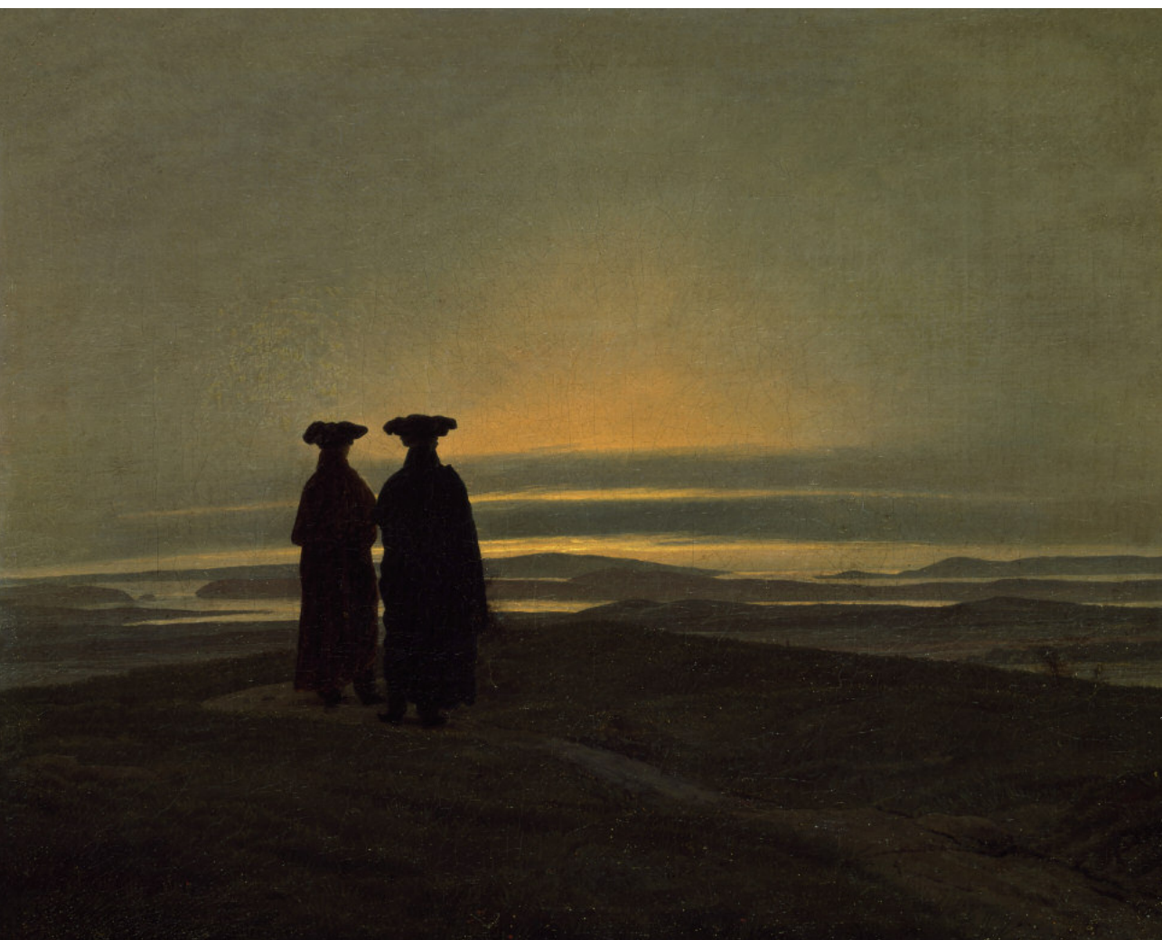
Abendlandschaft mit zwei Männern, Caspar David Friedrich, ca. 1830.