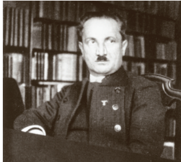
Denker des »Ab-grunds«: Martin Heidegger, 1933.