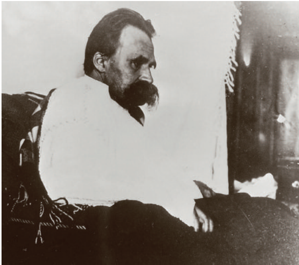
Denker im Abgrund: Friedrich Nietzsche, 1899.

Jede Religion versucht zu erklären, warum die Welt ist, wie sie ist – wie Gott/die Götter sie gut erschaffen hat/haben, und die Menschen sie pervertieren und mit entsprechenden Strafen rechnen müssen. Seit Platon beteiligt sich auch die Philosophie an diesem erbaulich-kritischen Unterfangen. Heidegger macht endgültig Schluss damit. Der Philosoph soll der Angst vor dem nihilistischen Schlund nicht länger zu entkommen versuchen, indem er Gewissheitstürme errichtet, von deren Zinnen aus er die Lage zu überblicken glaubt. Im Gegenteil: Er soll sich mit Begeisterung in die Tiefe stürzen – das Leben im Sturzflug erfassen. Bis es an einer Klippe zerschmettert.