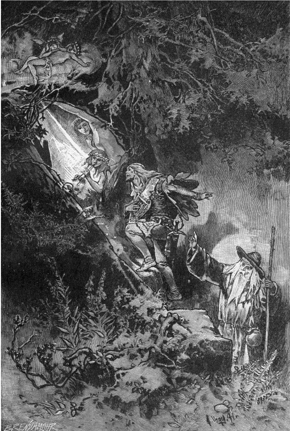
»Der verdammte Abgrund der Lust«: Tannhäuser vor dem Venusberg . Holzstich von 1891.