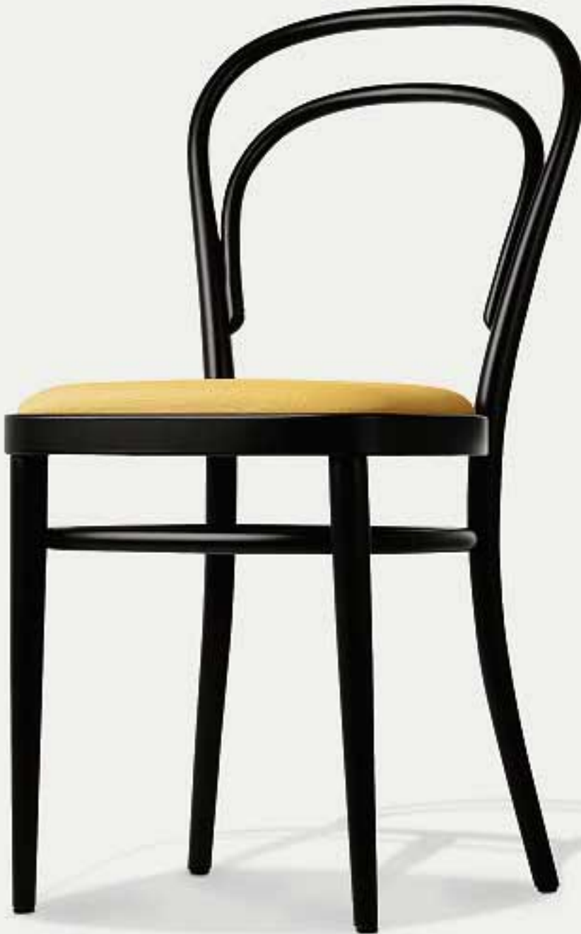
Michael Thonet, Kaffeehausstuhl Nr. 214, Re-Edition der Thonet GmbH