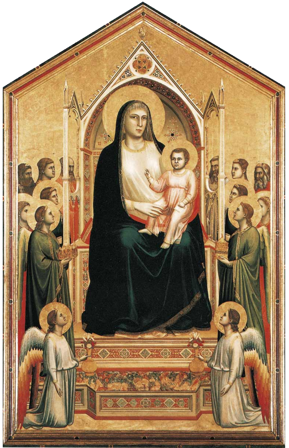
Madonna Ognissanti , 1310, Tempera auf Holz, 325 x 204 cm, Florenz, Galleria degli Uffizi