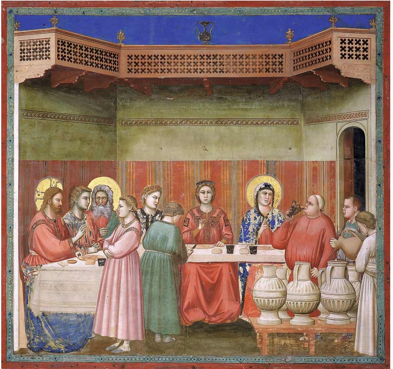
Giotto di Bondone, Die Hochzeit zu Kana (aus dem Zyklus mit Szenen aus dem Leben Mariä und Christi), um 1303–1306, Fresko, 185 x 200 cm, Padua, Arenakapelle