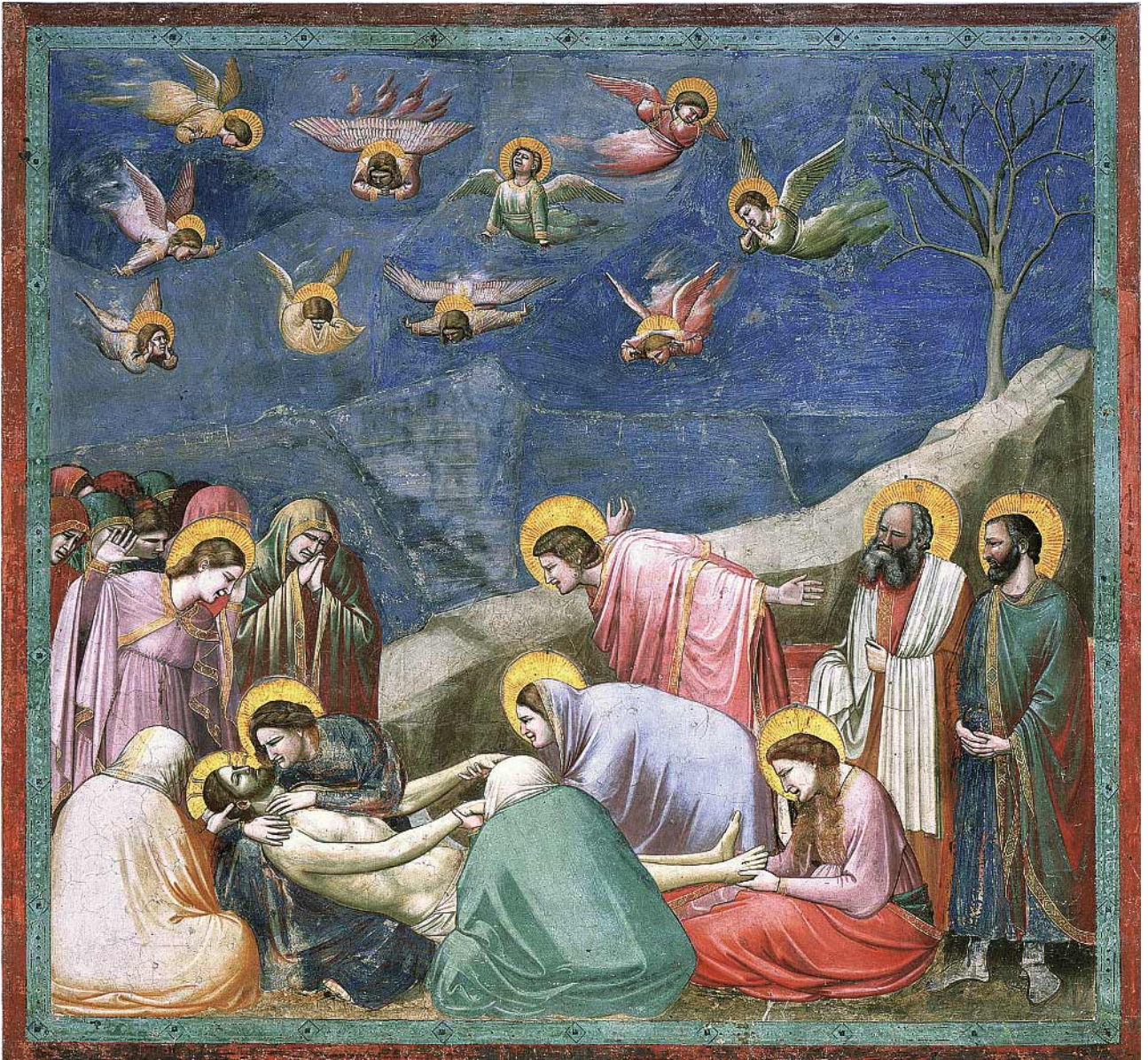
Giotto di Bondone, Die Beweinung Christi (aus dem Zyklus mit Szenen aus dem Leben Mariä und Christi), um 1303–1306, Fresko, 185 x 200 cm, Padua, Arenakapelle