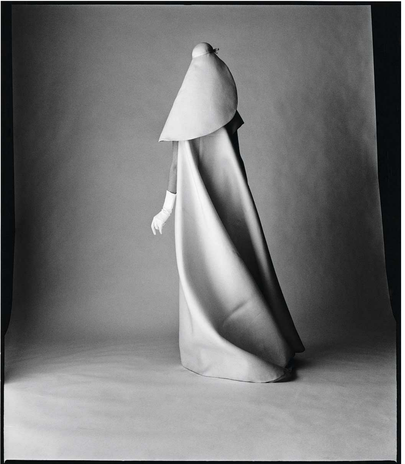
Balenciaga, American Vogue , 1967