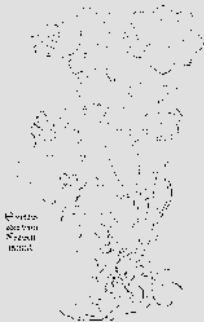
Frauenmanteldarstellung aus dem Kreütterbuch des Otto Brunfels (1532).