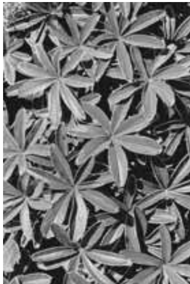
Die Blätter des Alpen-Frauenmantels sind tief gebuchtet und auf der Unterseite dicht silbrig behaart.

Die große Freundin der Alchemilla ist aber die Lärche, der lichteste aller Nadelbäume. Der Frauenmantel bevölkert den gehaltvollen Boden lichter Lärchenwälder. Dadurch, dass die Lärche im Herbst ihre goldenen Nadeln abwirft, düngt sie den Waldboden für den Frauenmantel und schafft überhaupt fruchtbaren Boden für eine artenreiche Flora.