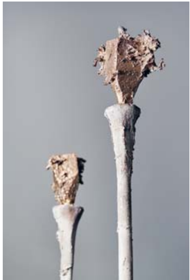
PLACCA bronze, 31 × 35 × 27 cm — 2015