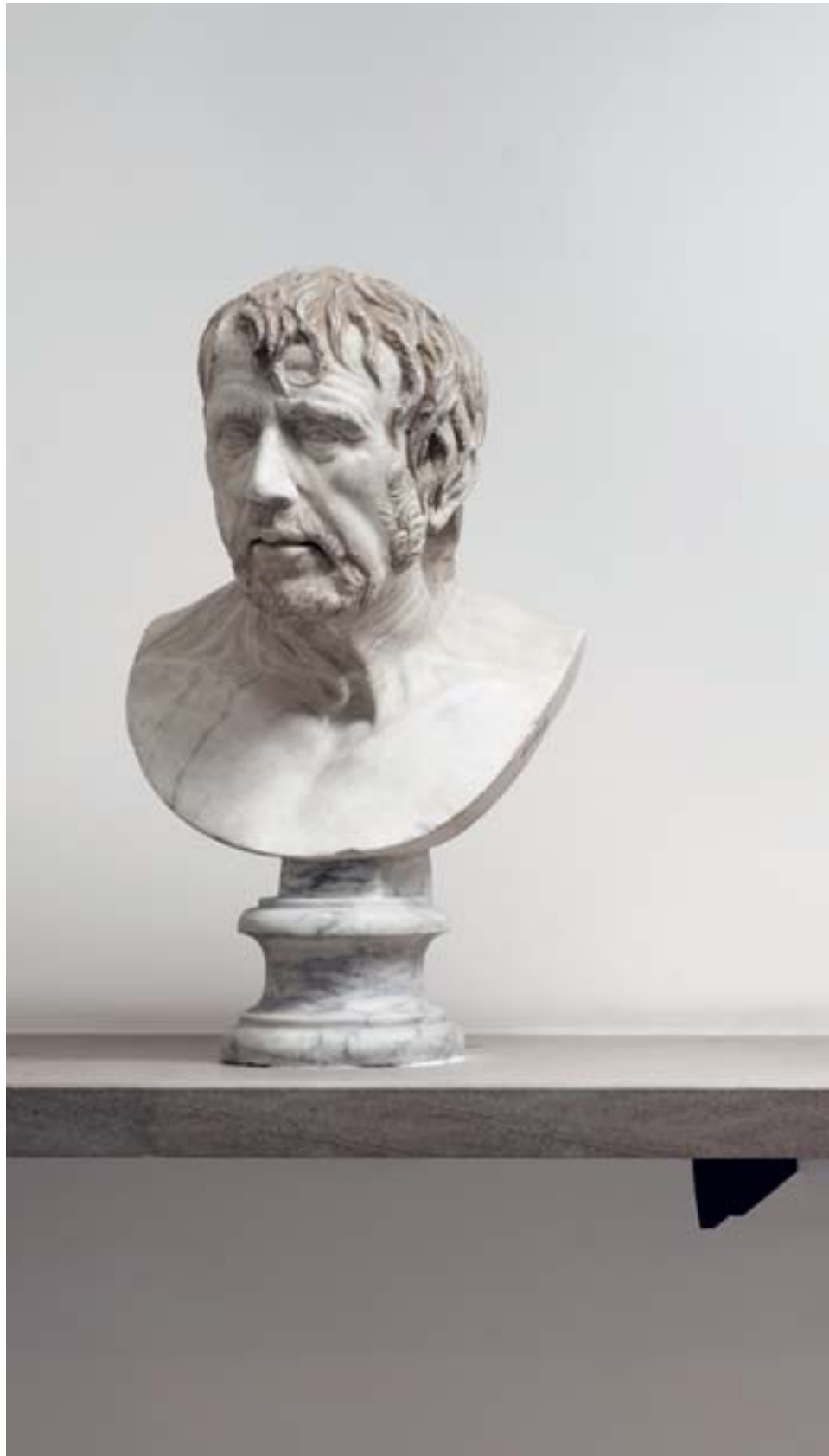
BILANZ bronze and fired clay, 55 x 33 x 30 cm — 2016 Exhibition shot at the Museo Archeologico Nazionale in Naples