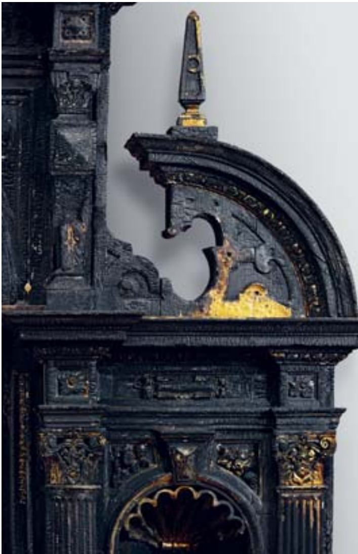
Detail of ARA COR (L'ECO DELLA CENERE) on pages 154 – 155