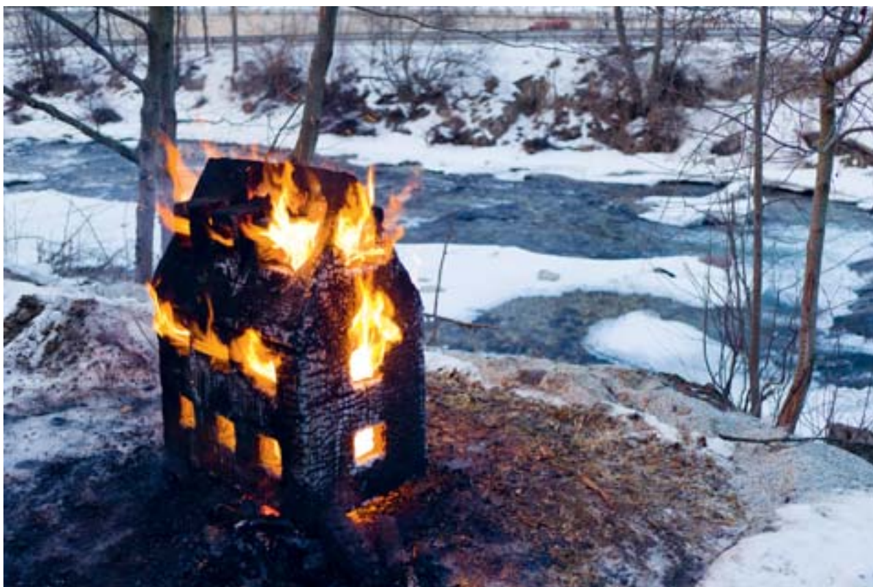
TRAGEDIA DELL'UNIVOCITÀ CASA charred cedarwood, 100 × 80 × 52 cm — 2011