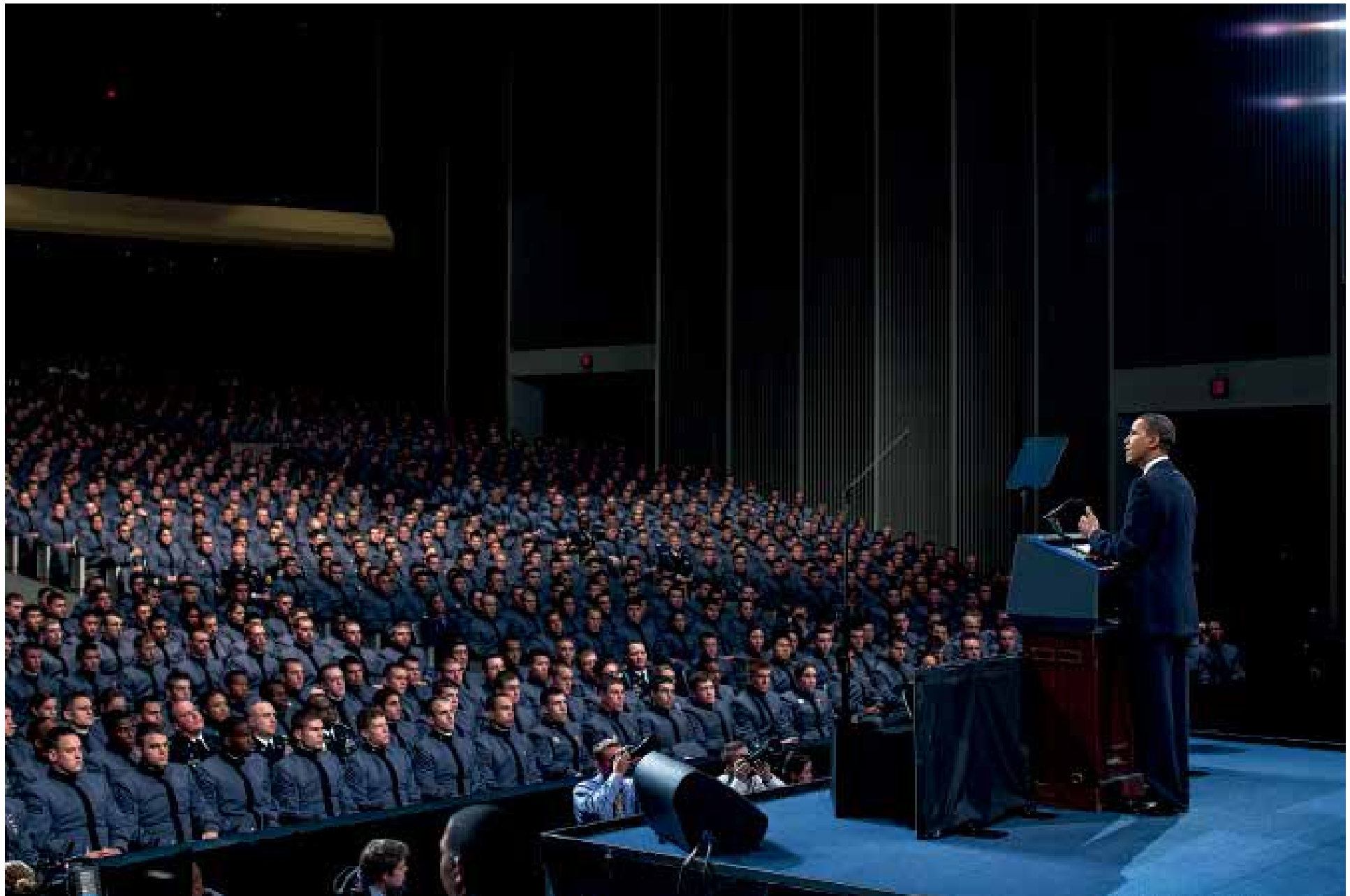
Während einer Rede vor Kadetten in West Point verkündet der Präsident seine Entscheidung, 30 000 weitere US-Soldaten nach Afghanistan zu schicken. Viele der Anwesenden nahmen später an dem Einsatz teil. 1. Dezember 2009