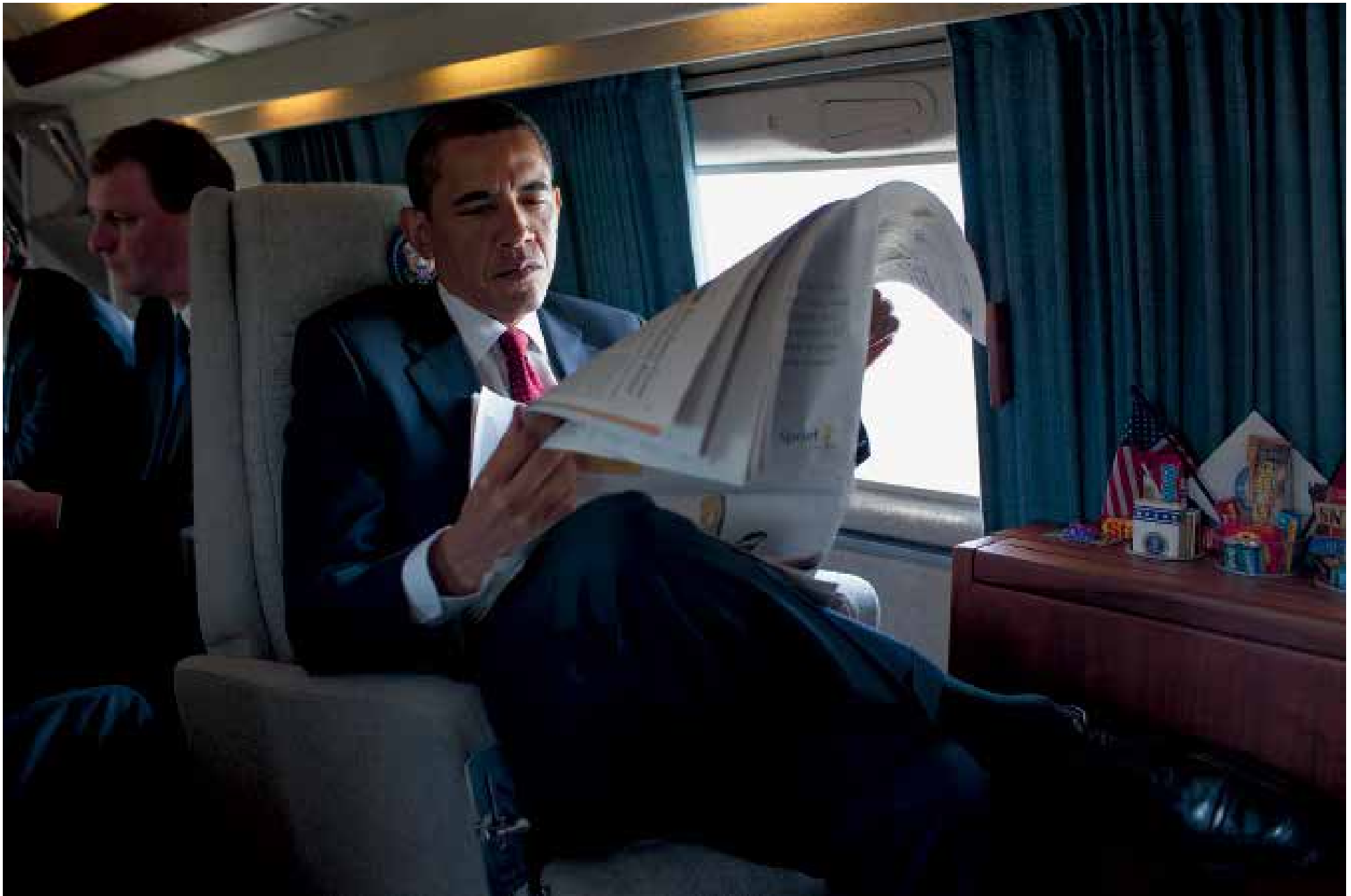
An Bord des Hubschraubers Marine One auf dem Weg zu einer Rede vor Absolventen der Naval Academy. 22. Mai 2009