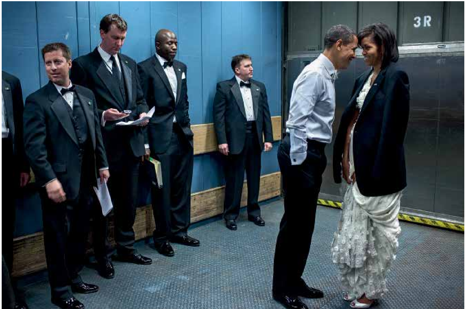
Präsident und First Lady in einem Lastenaufzug auf dem Weg zum Ball anlässlich seiner Amtseinführung. Es war so kühl, dass er ihr seine Anzugjacke über die Schultern legte. 20. Januar 2009, 23 Uhr