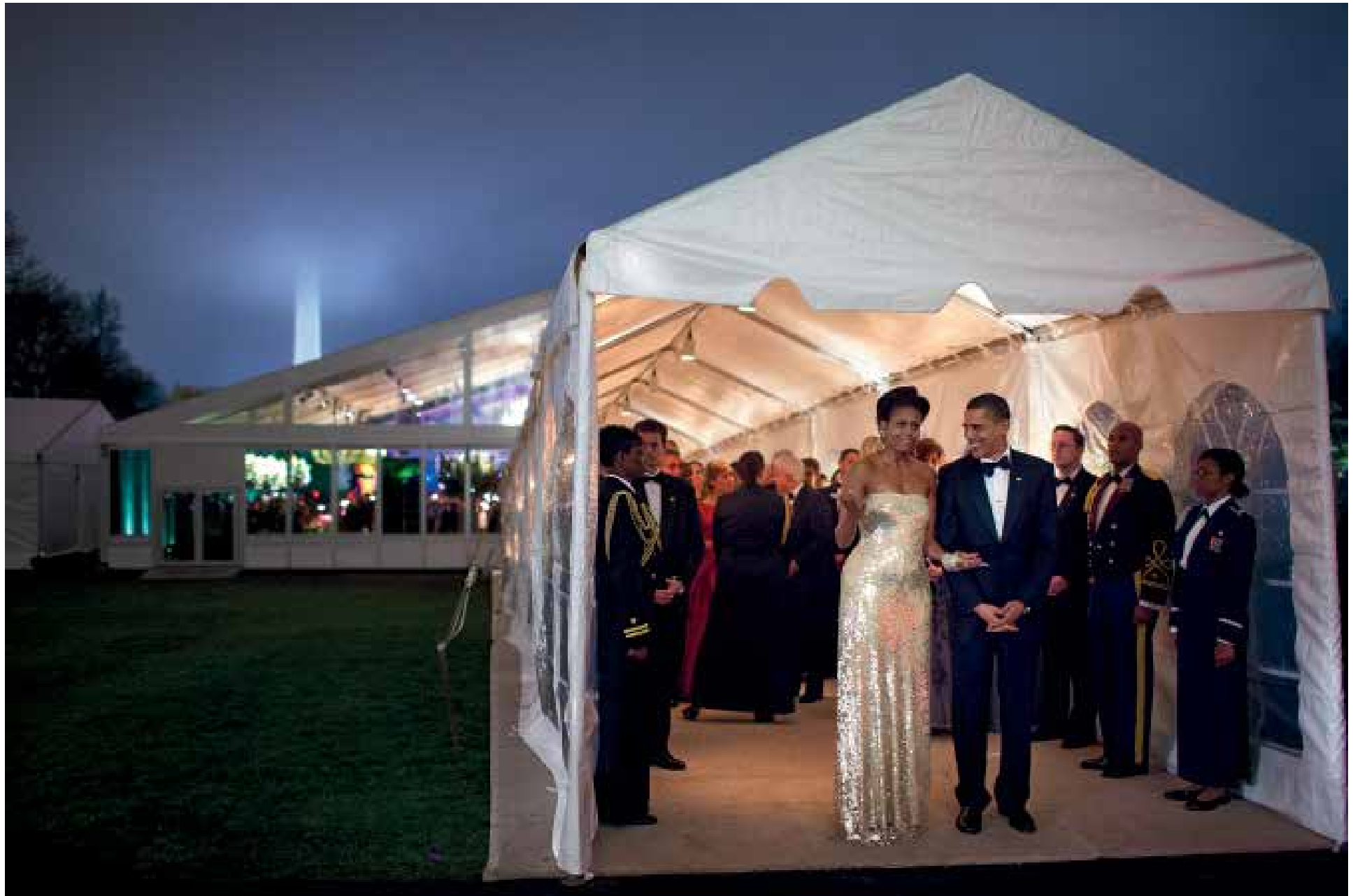
Nach einem Staatsbankett für den indischen Premierminister Manmohan Singh auf dem Südrasen des Weißen Hauses. 24. November 2009