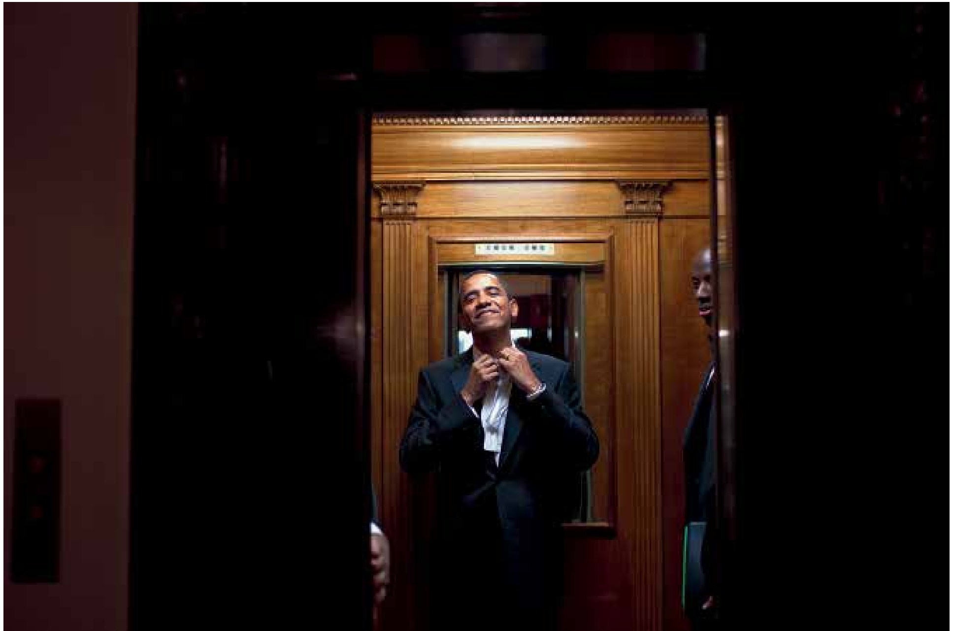
Nach der Amtseinführung im Aufzug zur Privatwohnung im Weißen Haus. 21. Januar 2009, 2 Uhr