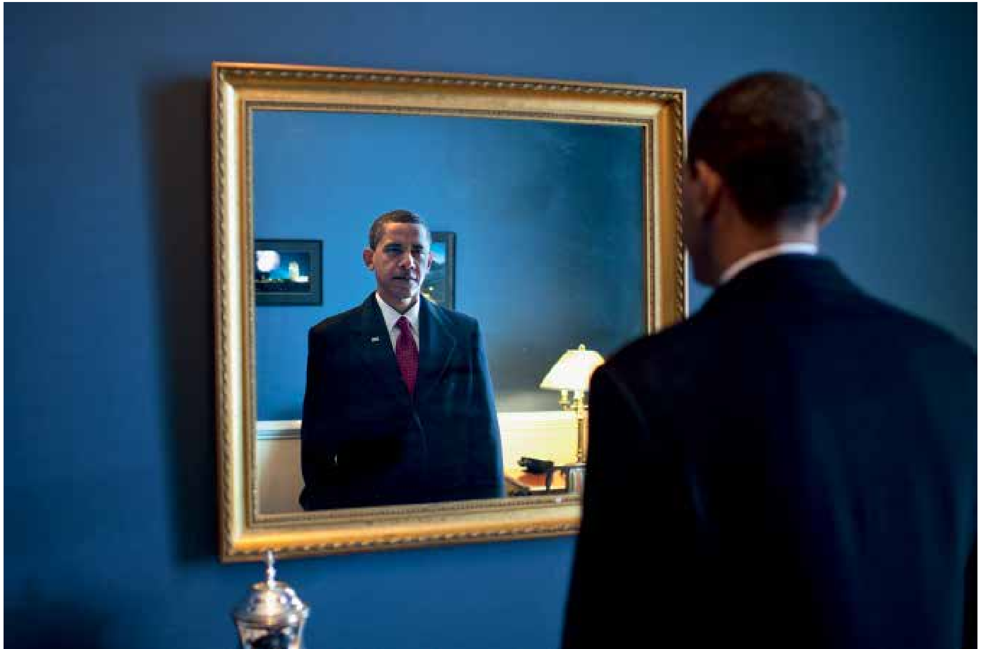
Wenige Momente vor der Amtseinführung. 20. Januar 2009