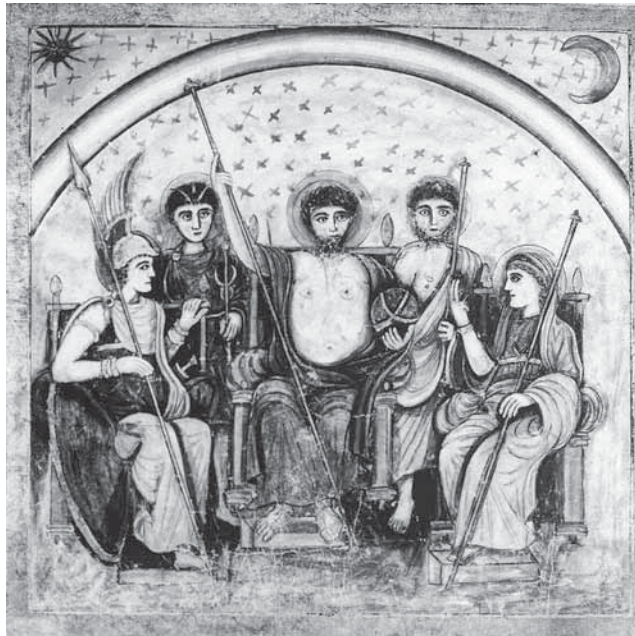
Götterkonzil, vatikanische Miniatur aus dem fünften Jahrhundert

In der heidnischen römischen Religion herrschte unter den Göttern eine hierarchische und funktionale Ordnung. Die seltene Darstellung eines Pantheons stammt schon aus christlicher Zeit, wenn auch aus einer Handschrift des Vergil.