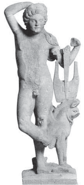
Statue des Apollo Grannus mit Leier und Greif aus dem Heiligtum von Hochscheid im Hunsrück

Gleiches ist auch von den (West-)Germanen anzunehmen. Im Unterschied zu Caesar, der diesen nur den Kult von Naturkräften zugeschrieben hatte, nannte Tacitus mehrere germanische Götter, wiederum in römischer Umdeutung: »Unter den Göttern verehren sie am meisten Merkur, dem sie an bestimmten Tagen auch Menschenopfer darbringen zu müssen glauben. Herkules und Mars suchen sie durch erlaubte, das heißt Tieropfer, zu gewinnen.« 7 Ob hinter Merkur der Kriegs-