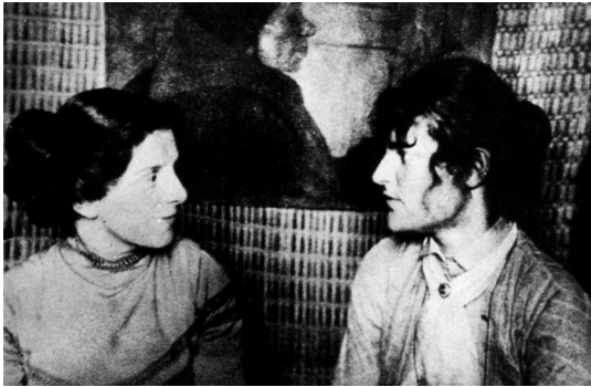
Paula Becker und Clara Westhoff in Beckers Atelier in Worpswede, 1898

früh den Aufbruch gewagt, in München und Berlin studiert und das Ziel, sich allen herrschenden Vorurteilen zum Trotz in der Kunstwelt zu behaupten und die Kunst zu ihrem Beruf zu machen. Wir haben uns gern und achten uns und lernen viel voneinander , notiert Paula Becker in diesen Tagen über ihre beginnende Freundschaft zu Clara Westhoff.