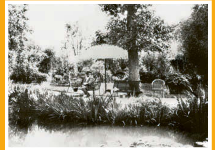
Claude Monet beim Malen am Seerosenteich

Fast ebenso berühmt wie seine Gemälde waren das Haus und der Garten in dem Dorf Giverny, wo Claude mit seiner großen Familie lebte. Am liebsten saß er dort an seinem Teich und malte seine japanische Brücke und die Seerosen.