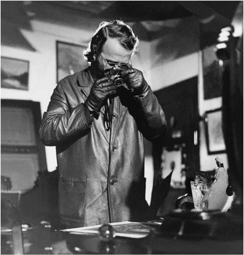
Beim Trödler in Grasberg 1972