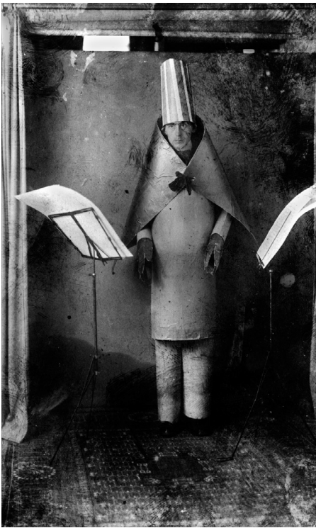
Hugo Ball im kubistischen Kostüm