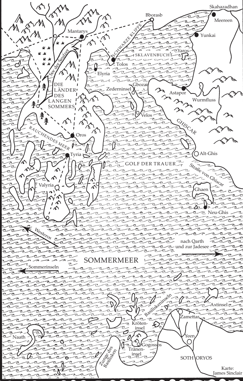
Karte: James Sinclair