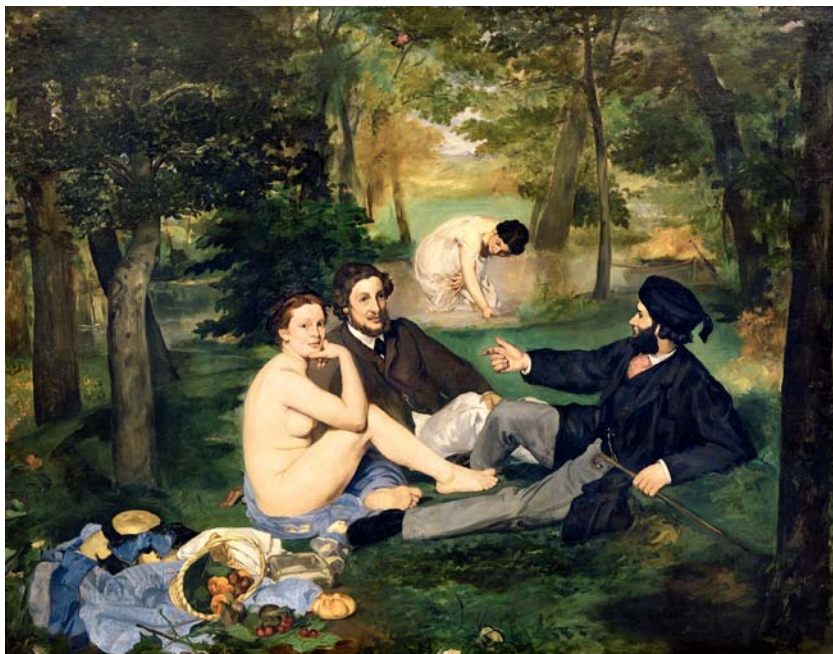
Abb. 1-6. Édouard Manet, Das Frühstück im Grünen (1863). Öl auf Leinwand.

Kunst ist eine Institution, der wir uns immer dann zuwenden, wenn wir uns schockieren lassen wollen. Dieses Bedürfnis empfinden wir, weil wir spüren, dass ein gelegentlicher heilsamer Schock uns guttut. Sonst würden wir allzu leicht in einen Trott geraten und neuen Herausforderungen, die das Leben uns stellt, nicht mehr gewachsen sein. Die Kunst hat also, anders gesagt, die biologische Funktion einer Probe, eines Trainings in mentaler Gymnastik, das uns hilft, mit dem Unerwarteten umzugehen. 3