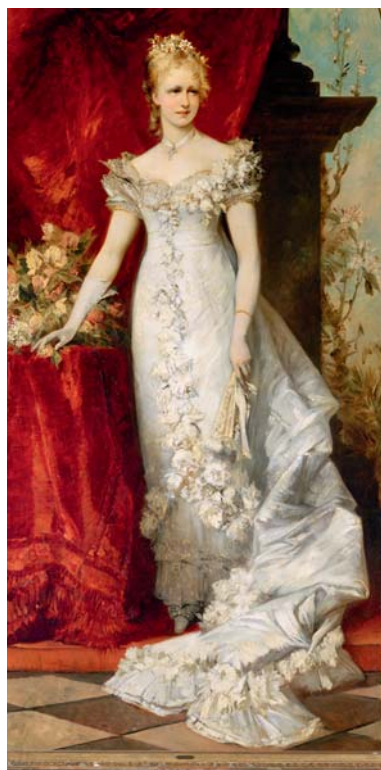
Abb. 1-2. Hans Makart, Kronprinzessin Stephanie (1881). Öl auf Leinwand.

formen. Mit diesem Gemälde schuf Klimt eine säkulare Ikone, die im Wien des Fin de Siècle für die Hoffnungen einer ganzen Generation stehen sollte. 1