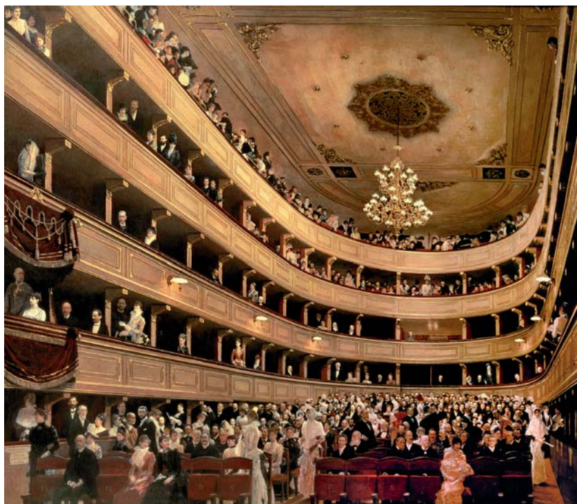
Abb. 1-4. Gustav Klimt, Zuschauerraum im alten Burgtheater (1888). Öl auf Leinwand.

sonsten unspektakulär waren. Er war ein guter, aber konventioneller Maler, ein Dekorateur von Theatern, Museen und anderen öffentlichen Gebäuden, der sich an dem prachtvoll-historistischen, konventionellen Stil seines Lehrers Hans Makart orientierte (Abb. 1-2). Genau wie der talentierte Farbenkünstler Makart, den die Wiener Kunstmäzene voll Verehrung den neuen Rubens nannten, malte Klimt große Porträts mit allegorischen und mythologischen Themen (Abb. 1-3).