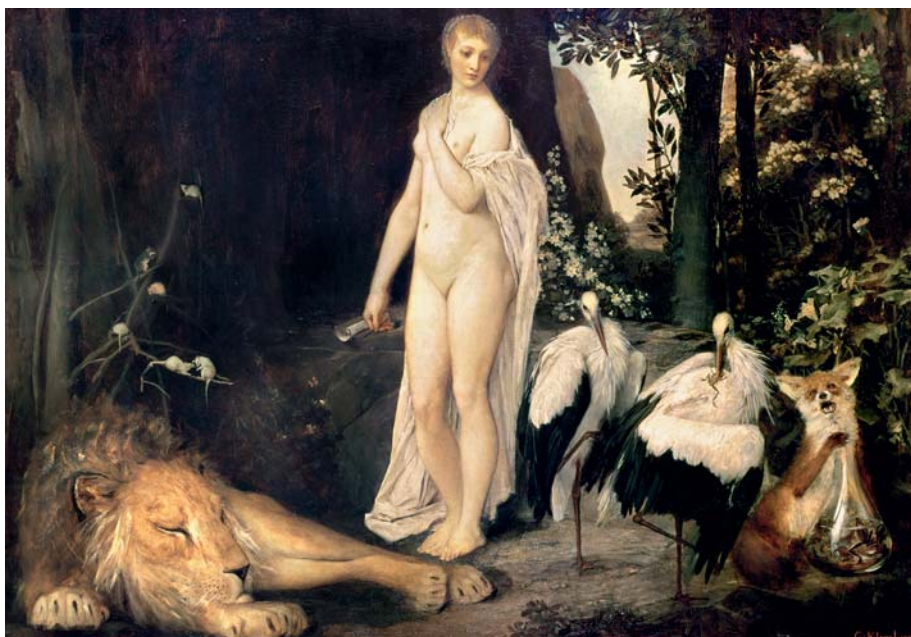
Abb. 1-3. Gustav Klimt, Fabel (1883). Öl auf Leinwand.

modernen Biologie, auf Klimts Kunst und in erheblichem Maße auch auf die Kultur von »Wien 1900«, der Epoche von 1890 bis 1918. Wie von der Kunsthistorikerin Emily Braun dokumentiert, las Klimt Darwin; ihn faszinierte die Struktur der Zelle – des wichtigsten Bausteins allen Lebens. So sind die kleinen ikonografischen Bilder auf Adeles Kleid nicht einfach dekorativ, wie andere Bilder der Jugendstil-Epoche. Sie sind vielmehr Symbole männlicher und weiblicher Zellen – rechteckiger Spermien und ovoider Eizellen. Diese biologisch inspirierten Fruchtbarkeitssymbole sollen eine Verbindung zwischen dem verführerischen Gesicht des Modells und ihrer voll erblühten Fähigkeit zur Fortpflanzung herstellen.