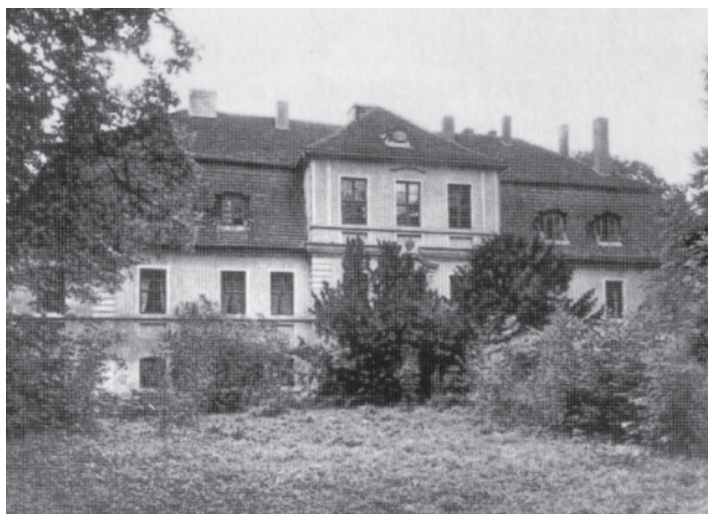
Seit 1345 besaßen die Bismarcks Anteile am Gut Döbbelin in der Altmark, das von 1375 bis 1945 in ihrem festen Besitz war. Bis zu ihrem Tod 1963 lebte eine 1880 geborene von Bismarck im Herrenhaus. Seit 1991 gehört das Anwesen wieder der Familie.

die – wie ein Blick auf die Topographie der Besitzungen zeigt – auf einen möglichst geschlossenen Besitz hinzielte.