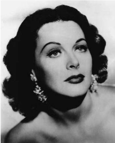
Hedy Lamarr, Hollywoodstar und geniale Erfinderin

kanten Fritz Mandl, und machte Weltkarriere. Später sollte sie ihren Beitrag im Kampf gegen NS-Deutschland leisten. Die als »schönste Frau der Welt« Gefeierte hatte an der Seite ihres Manns