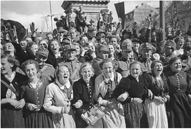
Begeisterung bei der Ankunft Hitlers in Klagenfurt

breiten Absätzen, ohne Ohrringe, möglichst ohne Vermögen. Vermittler abgelehnt, Verschwiegenheit zugesichert.« 28