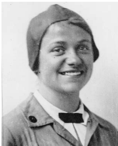
Hanna Reitsch, die berühmte Testpilotin

Während Hitler Frauen öffentlich geistig Zurückgebliebenen gleichsetzte, meinte er im privaten Kreis: »Die Frauen, sagt man, seien nicht schöpferisch. Es hat aber eine große Frau gegeben, und es ärgert mich, daß die Männer da nicht gerecht