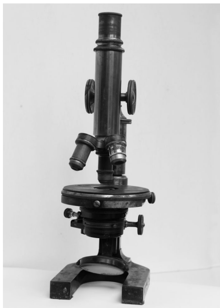
Abb. 1 Dieses Mikroskop, ein Geschenk meines Großvaters, hat mich in die Biologie geleitet. Mein Großvater hatte es für seine Studien an Planktonorganismen und Schwämmen verwendet.

Nach der enttäuschenden Reaktion meines Biologielehrers lief ich wieder nach Hause, setzte mich an mein Mikroskop, tropfte etwas von dem ominös verfärbten Teichwasser auf den Objekt-