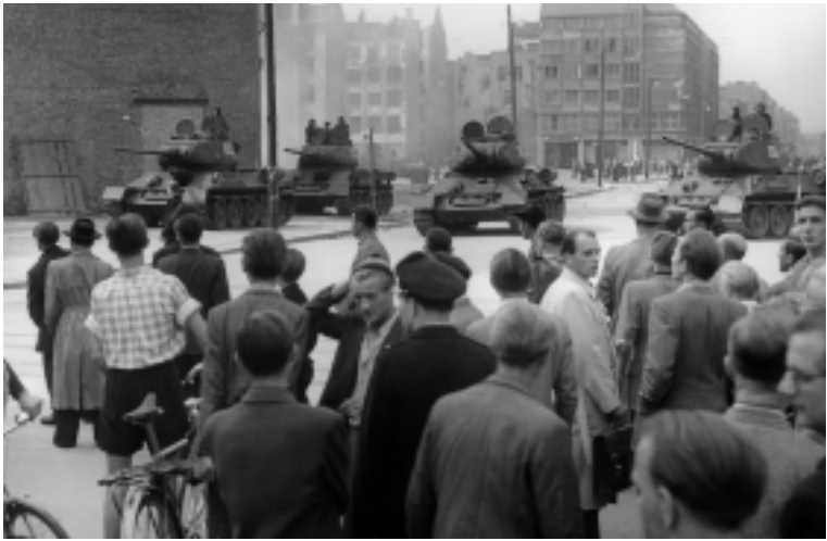
»Wie feige darf man, wie mutig muß man da sein?« Volksaufstand am 17. Juni 1953 in Ost-Berlin

sind die objektiven Chancen im Geschichtsprozeß in diesem flüchtigen Moment: Lebt er grade in der »blei-