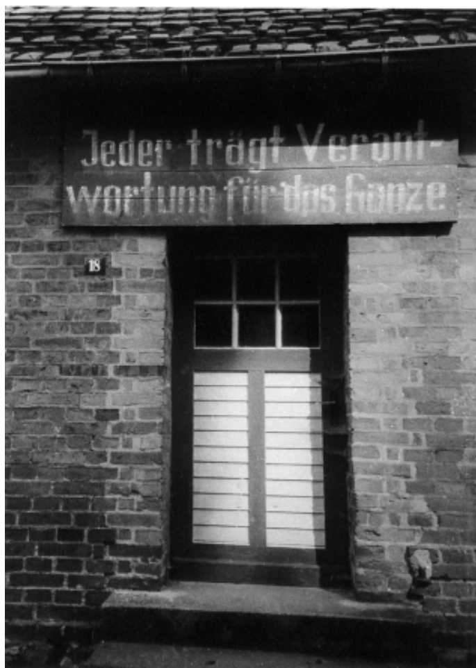
Groß Gievitze in Mecklenburg, 1987