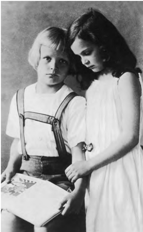
Dietrich und Sabine Bonhoeffer im Jahr 1914

Dietrich glaubte, das abendliche Ritual bewahre ihn davor, »vom Satan verschlungen zu werden«. Das schrieb Sabine später, gleichwohl