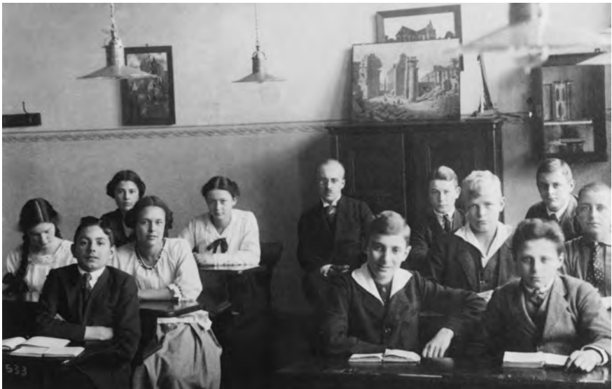
Dietrich Bonhoeffer (Vierter von rechts) im Grunewald-Gymnasium, 1920-21

1913, ein Jahr nach dem Umzug nach Berlin, als sie noch in der gemieteten Wohnung neben dem überlaufenen Tiergarten wohnten, hat-