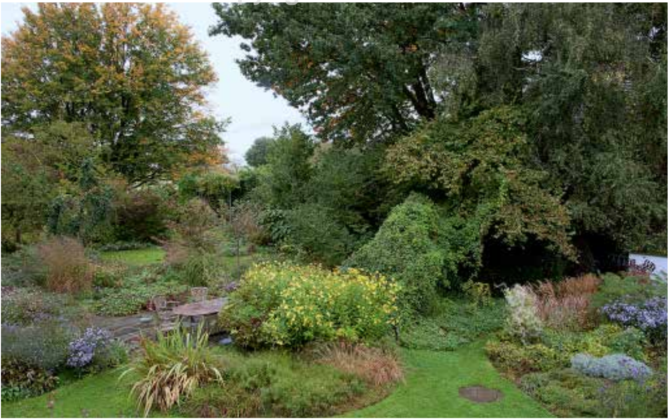
Blick zum Steingarten und dem »Gelben Beet« am Sitzplatz; im Hintergrund die Baumkulisse aus Eiche, Esche und Hainbuche.

sandiger Lehm. Nicht zu leicht, nicht zu schwer und immer gut zu bearbeiten. Nettetal liegt in der Winterhärtezone 8a, das Klima ist ausgesprochen mild.