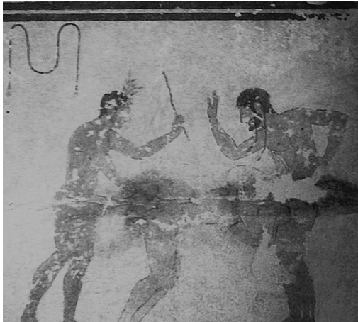
Tomba della Fustigatione

Die wohl älteste Darstellung einer erotischen Züchtigung findet sich in einer etruskischen Grabstätte (aus dem Jahr 490 vor unserer Zeitrechnung). Das Bild zeigt eine erotische Szene mit zwei Männern und einer Frau. Einer der Männer züchtigt die Dame mit einem Stock, der andere schlägt sie mit der Hand. Und alle drei scheinen dabei ziemlich viel Spaß zu haben!