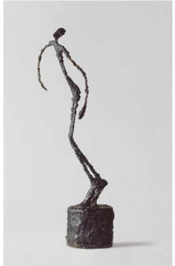
3 — Alberto Giacometti — Der Käfig (Erste Fassung) The Cage (First Version) — 1950 — Bronze — 91 × 36,5 × 34 cm — Collection Fondation Alberto & Annette Giacometti, Paris

transparent enclosure vaguely suggested with thin lines and partially overlapped by the vertical brush strokes of the curtain. In a desperate gesture, the figure, emphasised with bluish, orange and whitish colour accents, attempts to draw the dense veil to the side. This nude is a figural cipher, one whose intense, 'Existentialist' expressivity has much in common with a work like Giacometti's Falling Man (1950; FIG. 4) plunging into emptiness. Bacon never doubted that the task of a 'good artist' was 'tearing away the veils that fact acquires through time'. 19 Giacometti too wished to capture reality holistically, but had to recognise that one can only depict its momentary manifestations. He approached a solution by oscillating between distance and closeness;