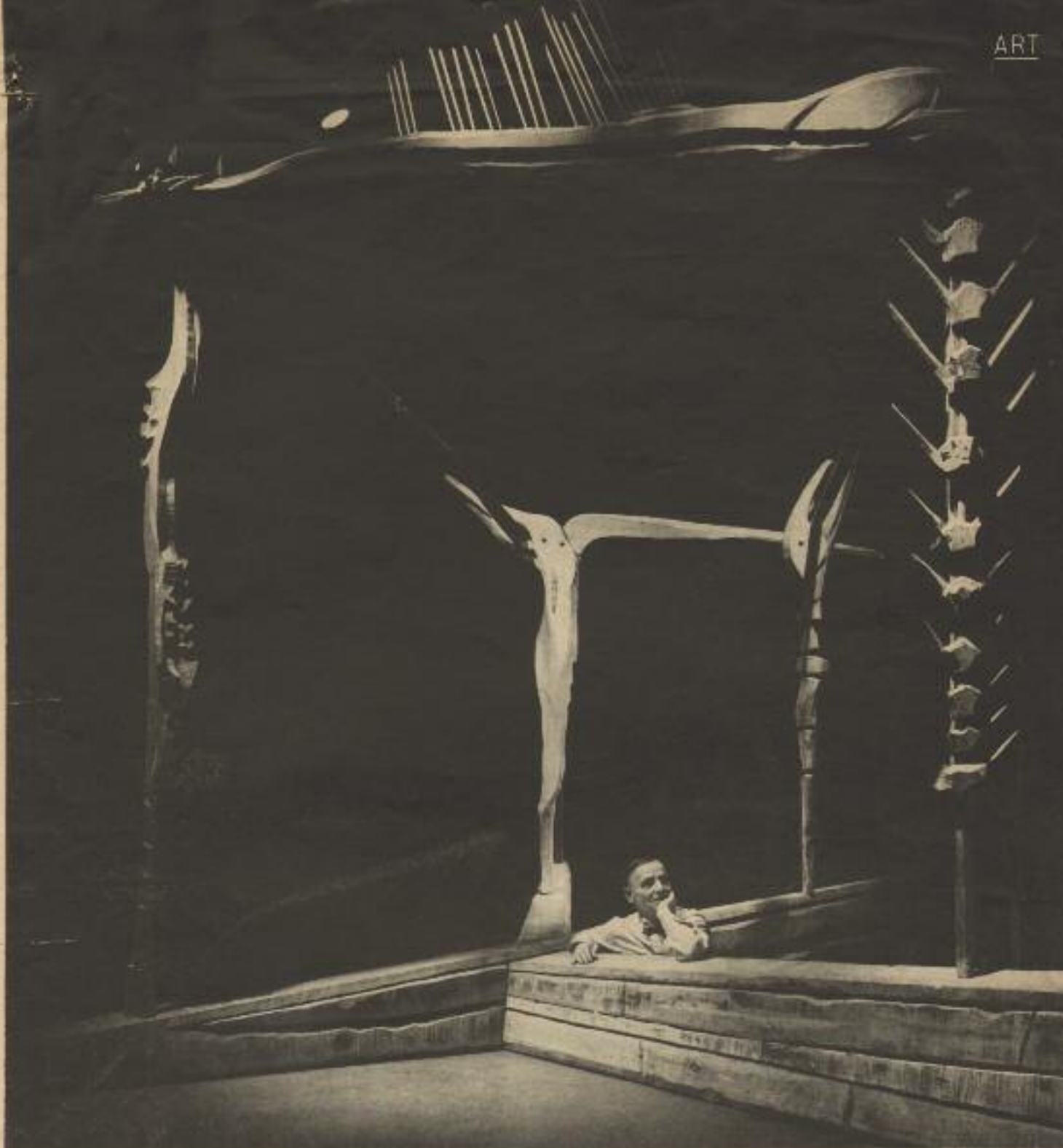
KIESLER DEMONSTRATES HOW TO LIVE WITHIN HIS SPACE-SCULPTURE "GALAXY." STRUCTURE, 12 FEET HIGH, IS HELD TOGETHER WITH ROPE, WOOD PEGS