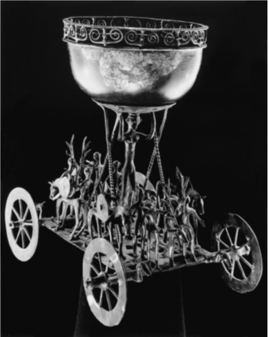
Der Kultwagen von Strettweg.