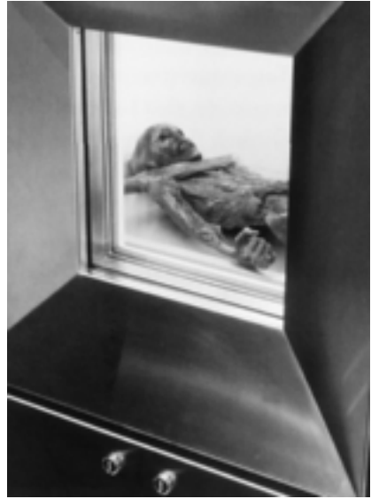
Der Ötzi (Mumie) im Kühlraum in Bozen.

meist nur aus Abbildungen kennt, für eine Großplastik halten. Das Original dieser nur wenige Zentimeter großen Figur einer beleibten Frau mit einem stark ausgeprägten Becken und dicken Oberschenkeln findet man im Naturhistorischen Museum in Wien. Die Fruchtbarkeit, das Gebären von Kindern, war in einer Gesellschaft mit hoher Säuglings- und Kindersterblichkeit eine wirkliche Überlebensfrage jeder Sippe.