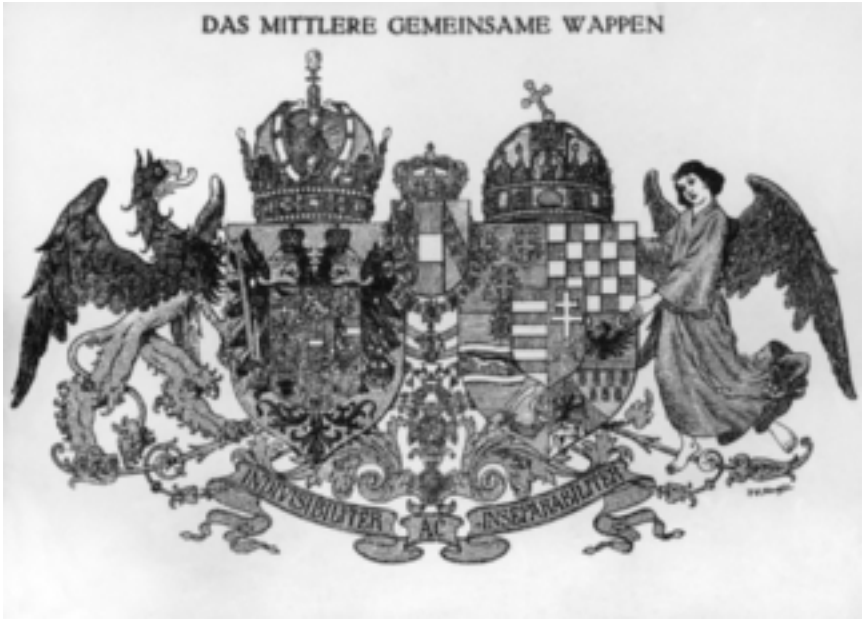
Das mittlere gemeinsame Wappen (Österreich-Ungarn), 1914.