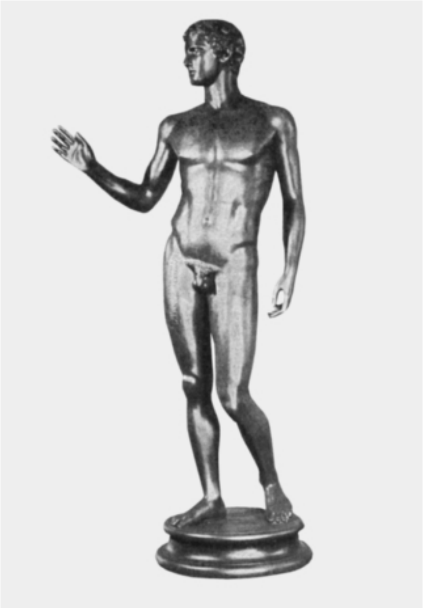
Der Jüngling vom Magdalensberg.