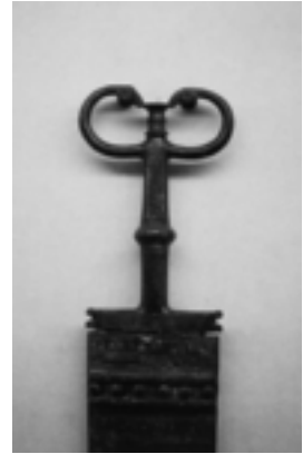
Fundgegenstände aus Hallstatt.

Aufschwung von Bergbau und Handel sowie verbesserte Rodungsmöglichkeiten charakterisieren die Bronzezeit. Ein ausgebreitetes Netz an Handelsbeziehungen war notwendig, um das Zinn aus Cornwall und das Kupfer aus den alpinen Lagerstätten zusammenzubringen. Außer dieser Ost-West-Straße durchschneidet auch die Bernsteinstraße, welche die Ostsee mit Südeuropa verband, Österreich und machte es zu einer zentralen Drehscheibe des Handels.