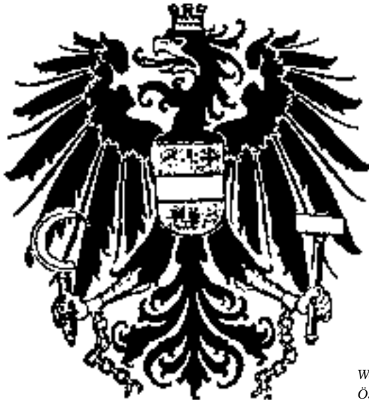
Wappen der Republik Österreich, 1945.