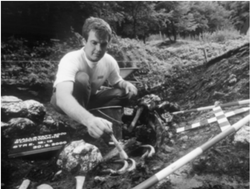
Ausgrabungen in Hallstatt.

Gemüse sowie Flachs und Hanf, die zur Herstellung von Textilien dienten. Als Haustiere hielten die keltischen Bauern Rinder, Pferde, Schweine, Schafe, Ziegen und Hühner, aber auch Hunde, die ebenfalls als Nahrungsmittel Verwendung fanden. Diese Bauern lebten im „vicus“, dem kleinen Dorf auf dem Lande, während die Zentren dieser Zeit durch die „oppida“ verkörpert wurden. In diesen befestigten Siedlungen wohnten die Handwerker, deren Produkte sich durch ästhetische Formgebung, großes Stilgefühl und kunstvolle Technik auszeichneten. Die Spitzenerzeugnisse der keltischen Blütezeit sind durchaus den Entwürfen moderner Designer zu vergleichen, besonders nach dem 5. Jahrhundert, als man mit Hilfe des Zirkels sehr komplizierte Muster und Ornamente zu konstruieren begann. Eine weitere Spezialisierung in der keltischen Gesellschaft stellte die Funktion des Schmiedes dar. Im Burgenland fand man einige Reste einfacher Brennöfen, mit deren Hilfe das Eisenerz verhüttet wurde. Man mischte Eisenerz mit Holzkohle in einer Grube und entzündete die Kohle, durch Gebläse wurde die richtige Temperatur erzeugt. Das Produkt dieses Vorgangs war eine Eisenluppe, also ein Kuchen, der aus stark mit Kohleresten verunreinigtem Eisen bestand, das man, um es weiter verarbeiten zu können, ausschmieden musste. Die daraus entstehenden Eisenbarren in einer eigenartigen, am Ende spitz zulaufenden Form wurden entweder