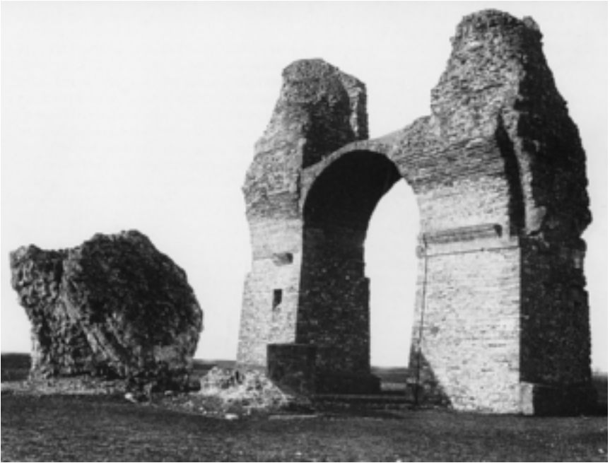
Das Heidentor von Carnuntum, 1. Viertel des 4. Jahrhunderts.

Prosperität der Zivilbevölkerung und zu einer Güterkonzentration im Donauraum, die sich auf die Lebensumstände der Menschen positiv auswirkte.