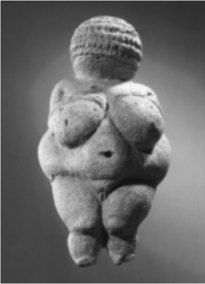
Venus von Willendorf.