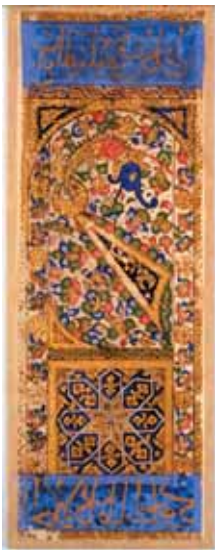
Ass der Stäbe

Geschichten über den Ursprung des Tarot gibt es viele. Es heißt, die Karten seien uralt und kämen aus Indien, Marokko oder aus Ägypten und hätten schon vor Jahrtausenden das Innere der Pyramiden geschmückt. Die nachprüfbare Geschichte ist dagegen eher kurz. Am Ende des 14. Jahrhunderts tauchten in Europa erstmals Karten auf, die vermutlich aus der islamischen Welt kamen. Karten aus dieser Zeit fand man im letzten Jahrhundert im Topkapi Museum in Istanbul. Sie stammen von den Mamelucken, einer Herrscherklasse, die seit dem 13. Jahrhundert Syrien und Ägypten regierten. Darauf sind erstmals die Symbole der vier Sätze zu sehen, die bis heute für Tarot-, aber auch für Spielkarten typisch sind: Schwerter (Pik), Kelche (Herz), Münzen (Karo) sowie die Stäbe, die zu Kreuz wurden. Als begeisterte Polospieler hatten die Mamelucken den Poloschläger zum Stabsymbol erhoben. In Europa aber fanden diese vier Serien interessanterweise eine Entsprechung in den vier mittelalterlichen Ständen: Schwerter = Ritter, Münzen = Kaufleute, Kelche = Klerus und Stäbe = Bauern.