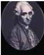
Antoine Court de Gébelin

Erst um 1505 taucht der Name Tarot in der italienischen Form als Tarocchi (Einzahl Tarocco) in Ferrara auf. Als Tarock wurde er im Deutschen ein Begriff für Kartenspiele, in der französischen Version gilt Tarot aber als der Name für das Kartenorakel. Was dieses Wort ursprünglich aussagte, ist leider nicht überliefert, dafür ranken sich umso mehr spekulative Interpretationen um seine mögliche Bedeutung. Sie reichen von königlicher Weg (Tar = Weg und Ro = König) über Thora, dem hebräischen Wort für Gesetz und der Sammelbezeichnung für die fünf Bücher Moses, bis hin zum Taro, einem norditalienischen Fluss, der durch Parma fließt.