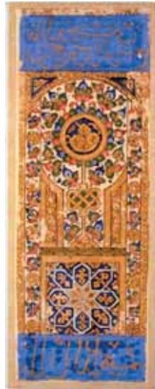
Ass der Münzen