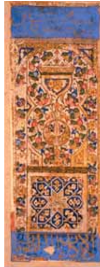
Ass der Kelche