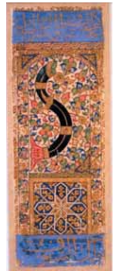
Ass der Schwerter