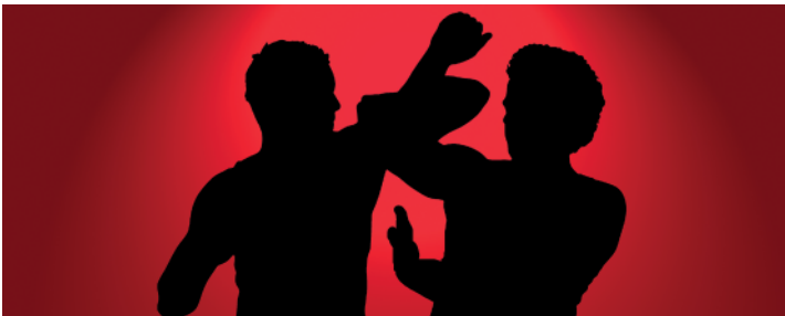
Abb. 3: Zwischenmenschlicher Ichwahn

Es ist nicht mehr zu übersehen, dass die Bedeutung des Ichs in unserer Gesellschaft stetig zunimmt. Standen früher noch der eigene Stamm und die Dorfgemeinschaft im Mittelpunkt des Geschehens, dreht sich das Leben heute bis auf wenige Ausnahmen (beispielsweise Naturvölker) in zunehmendem Maße um das Individuum. Doch diesem Trend sind natürliche Grenzen gesetzt: Der Lebensraum auf unserem Planeten ist räumlich begrenzt. Anders als früher spüren wir heute in nahezu allen Lebensbereichen die Präsenz unserer Mitmenschen. Mehrmals täglich müssen wir fremde Ansichten und Wünsche in unsere Entscheidungen einbeziehen, wenn wir gut miteinander auskommen wollen. Umso kleiner müssen die Freiheiten ausfallen, die wir uns gegenseitig einräumen. Wer glaubt, sich als Mitglied einer Gemeinschaft frei (also ohne Rücksicht auf andere Mitglieder) entfalten zu können, zerstört die Gemeinschaft, der er selbst angehört. Das fängt schon im Kleinen an, wenn sich zwei Menschen nicht in die Lage des jeweils anderen hineinversetzen können oder wollen (siehe Abbildung 3). Sie sehen nur sich selbst und nicht die Vorteile, die eine Gemeinschaft bietet.