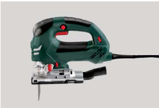
Stichsäge (Schnitttiefe 90 mm; min. 650 Watt)