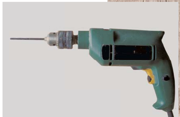
Bohrmaschine mit Holzbohrern