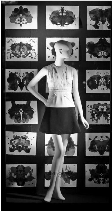
Schaufenster von Bergdorf Goodman, Fifth Avenue, New York, Frühjahr 2011

Goodman seine Schaufenster an der Fifth Avenue mit Rorschachmustern. T-Shirts im Rorschachstil waren unlängst bei Saks im Angebot, für stolze 98 Dollar. »Meine Strategie«, proklamierte eine ganzseitige Splash Page auf InStyle : »In dieser Saison fahre ich total auf Kleider und Accessoires ab, die eine gewisse Symmetrie aufweisen. Meine Inspiration: Die Muster der Rorschach-Tintenkleckse sind faszinierend.« Die amerikanische Horror-Serie Hemlock Grove , die Science-Fiction-Serie Orphan Black und die in einem Tattoo-Studio in Harlem angesiedelte Reality-Show Black Ink Crew flimmerten mit Rorschach-artigen Vorspannsequenzen über den Bild-