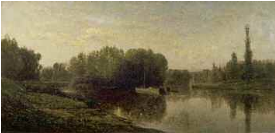
11) Charles-François Daubigny Ufer der Oise , 1859 Musée des Beaux-Arts, Bordeaux