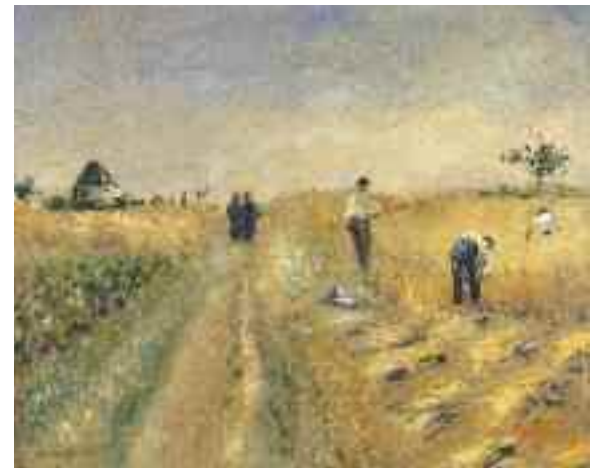
6) Pierre-Auguste Renoir Die Schnitter , 1873 Privatsammlung