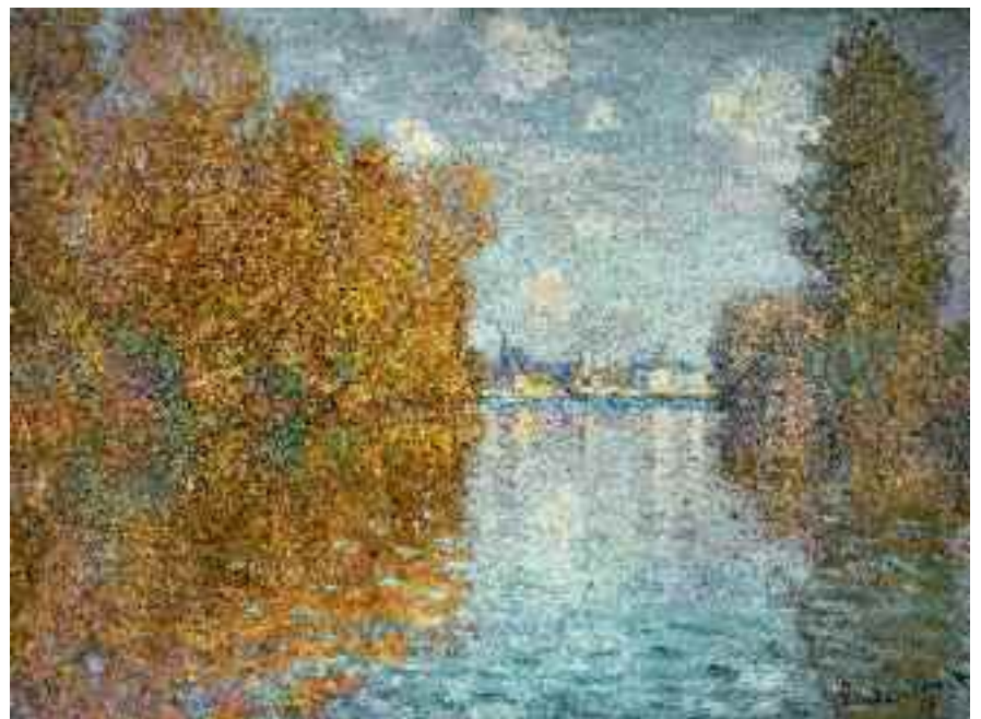
12) Claude Monet Herbst an der Seine, Argenteuil , 1873 The Courtauld Gallery, London, Samuel Courtauld Trust