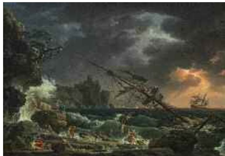
3) Claude Joseph Vernet Schiffbruch , 1772 National Gallery of Art, Washington, DC, Patrons' Permanent Fund und Chester Dale Fund