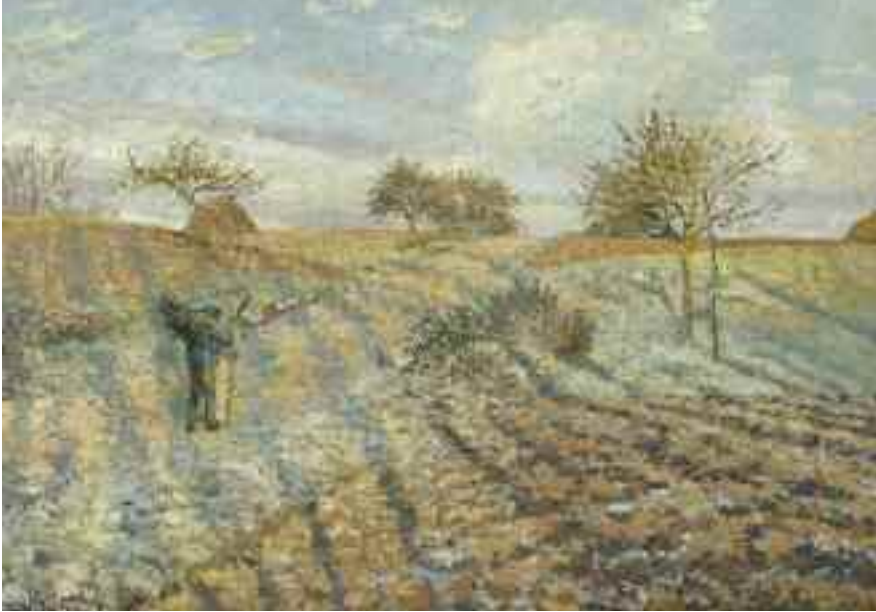
8) Camille Pissarro Raureif , 1873 Musée d'Orsay, Paris