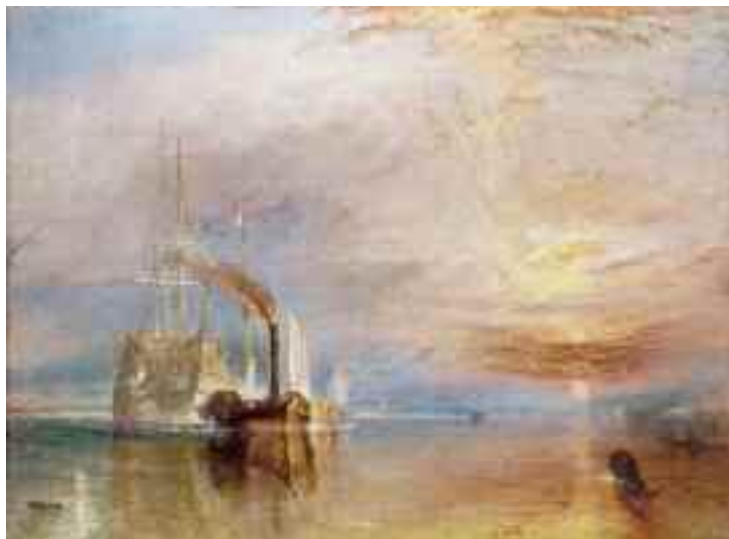
2) William Turner Die Fighting Temeraire wird zu ihrem letzten Liegeplatz geschleppt, um abgewrackt zu werden , 1838 The National Gallery, London