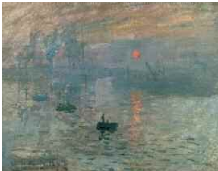
1) Claude Monet Impression, Sonnenaufgang , 1872 Musée Marmottan Monet, Paris