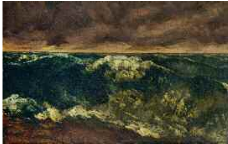
10) Gustave Courbet Brandungswelle , um 1870 Kunsthalle Bremen