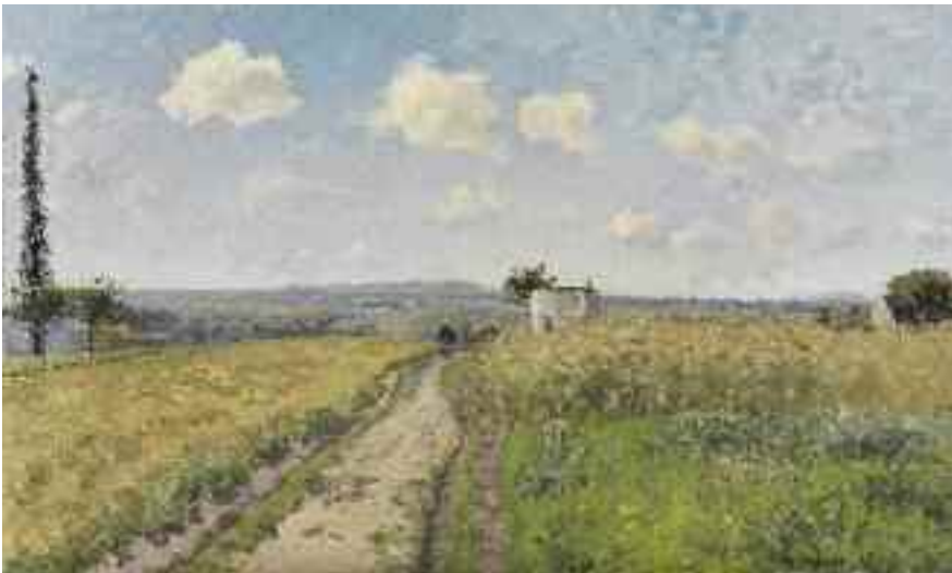
5) Camille Pissarro Junimorgen in Pontoise , 1873 Staatliche Kunsthalle Karlsruhe