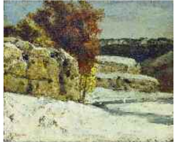
7) Gustave Courbet Winterlandschaft bei Ormans , 1865–1870 Von der Heydt-Museum, Wuppertal