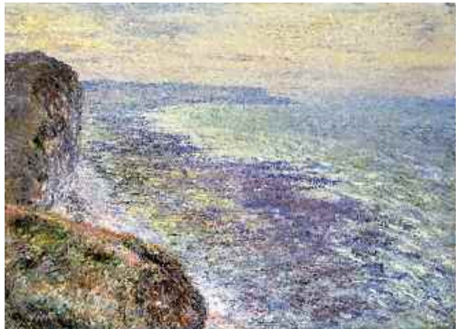
9) Claude Monet Bei Fécamp, Seestück , 1881 Privatsammlung