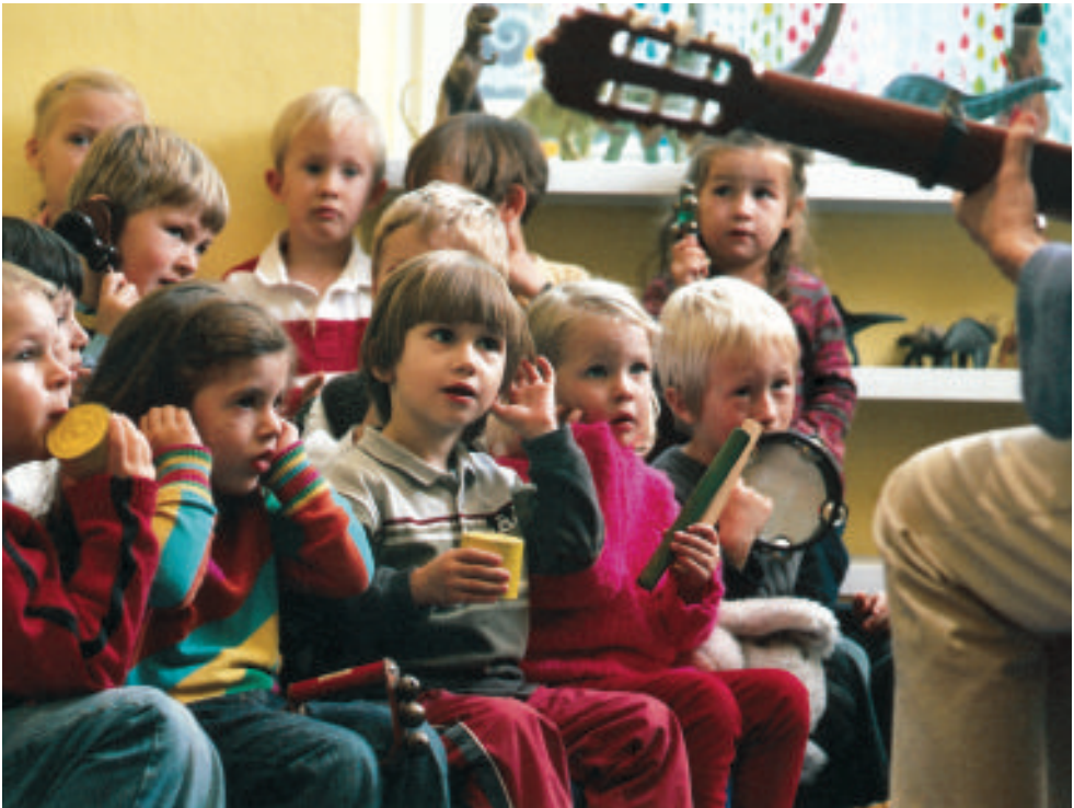
Musik weckt Aufmerksamkeit und Konzentration