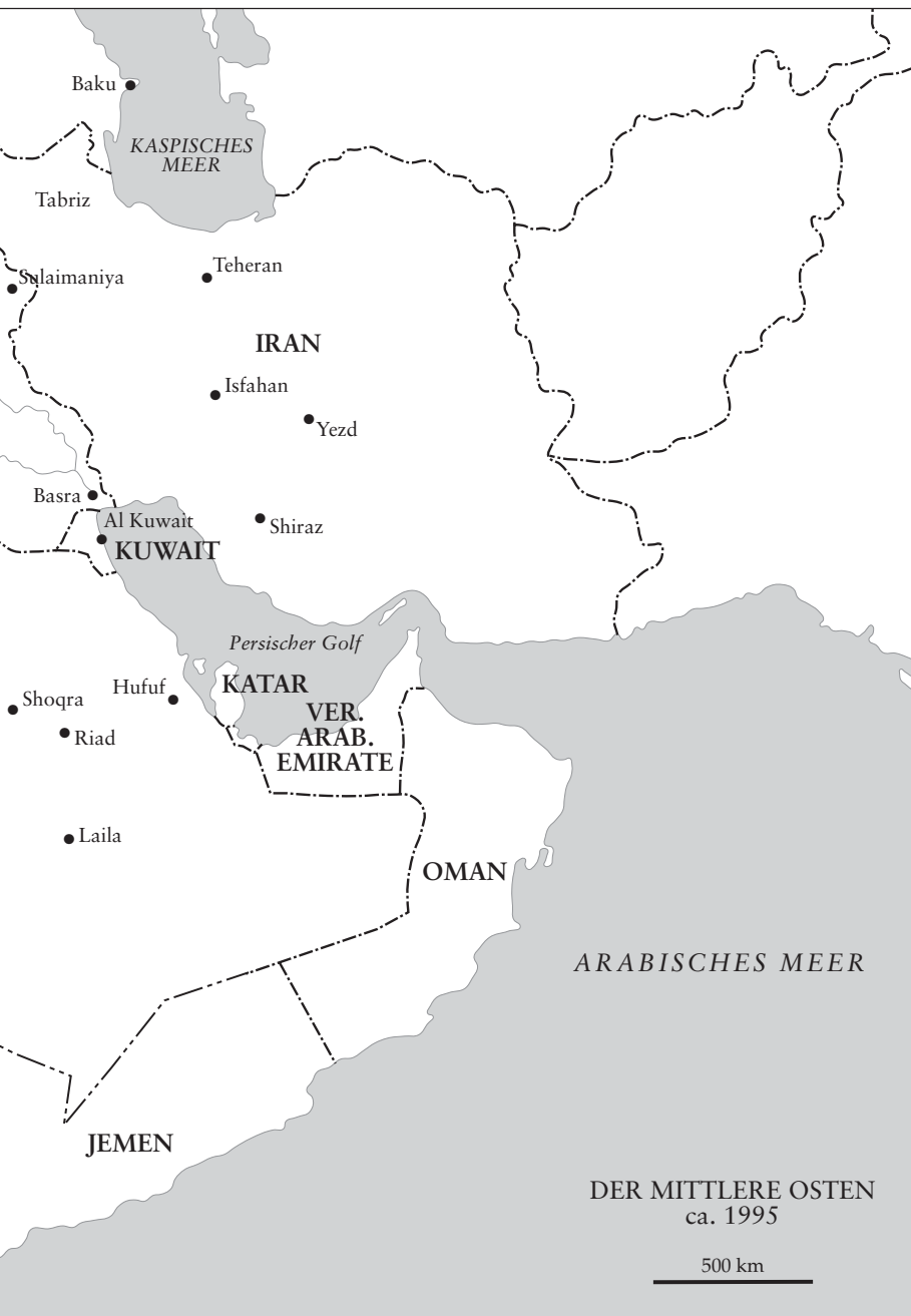
DER MITTLERE OSTEN ca. 1995