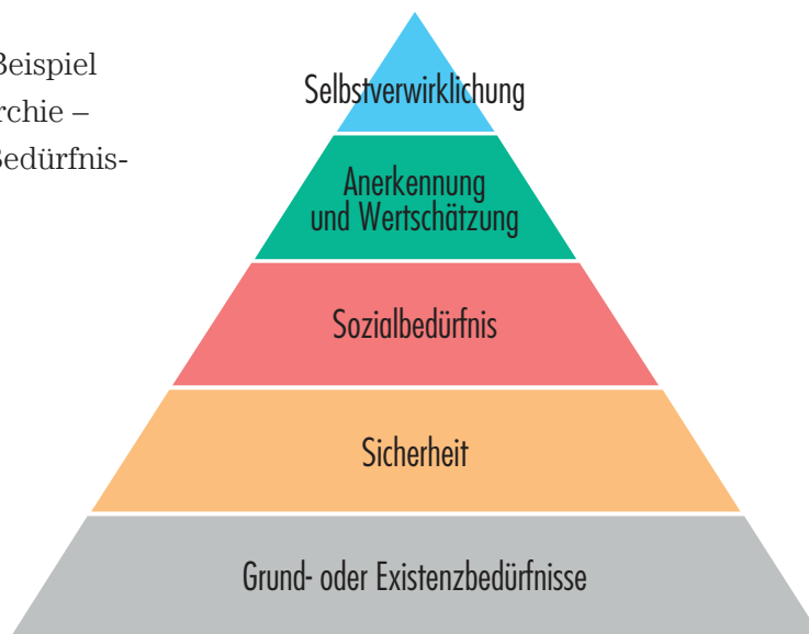
Abbildung 1: Beispiel für eine Hierarchie – Maslow'sche Bedürfnispyramide

Vielleicht kennst du die Bedürfnispyramide des Psychologen Abraham Maslow. Sie ist eine der bekanntesten Hierarchien überhaupt. Maslow beschäftigte sich mit einer faszinierenden Fragestellung: Was motiviert den Menschen? Seine Antwort drückte er – nach Prioritäten sortiert – in der Form einer Pyramide aus. 1