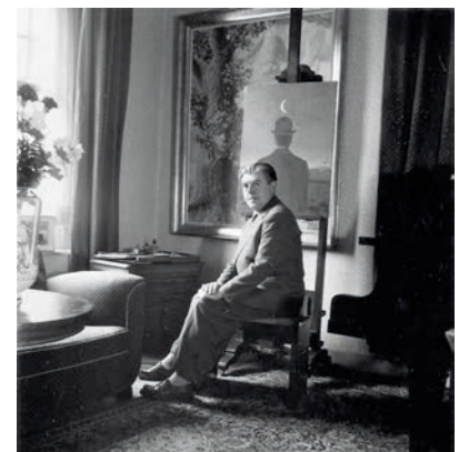
René Magritte und Le Maître d'école ( Der Schulmeister), um 1955