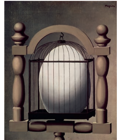
Les Affinités électives ( Die Wahlverwandtschaften ), 1932 Öl auf Leinwand, 41 × 33 cm Privatsammlung

Die Datierung der Wahlverwandtschaften zeigt, dass Magrittes Überwindung der Poetik des Schocks und des Arbiträren sich durchaus im politischen und „dialektischen“ Kontext des belgischen Surrealismus und der paranoisch-kritischen Methode vollzog. Mit diesem