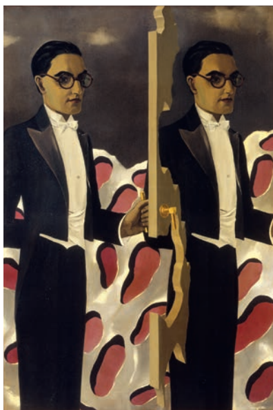
Portrait de Paul Nougé (Bildnis Paul Nougé), 1927 Öl auf Leinwand, 95 × 65 cm Musées royaux des beaux-arts de Belgique, Brüssel

an das Finden. Die Behauptungen des „Vortrags von Charlevoi“ hatten freilich in dem Moment, in dem er sie formulierte, ihren polemischen Charakter gegenüber dem Pariser Surrealismus verloren.