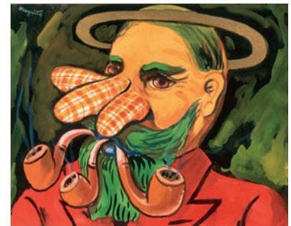
Le Stropiat (Der Krüppel) , 1948 Gouache, Bleistift, Goldlack auf Papier, 32,5 × 41 cm Privatsammlung

Magritte ließ zwar keine Gelegenheit aus, um die Philosophen hart anzugehen, pflegte aber den Kontakt zu ihnen. Durch den Austausch mit ihnen stellte er seine Gedanken auf die Probe und konnte sie vertiefen. De Waelhens und Perelman waren seine bevorzugten Gesprächspartner, er legte ihnen seine Texte zur kritischen Lektüre vor und holte ihren Rat für seine Interviews ein. Zwar blieb die Beziehung des Malers zu den Philosophen stets freundschaftlich, doch inhaltlich redeten sie aneinander vorbei. Magritte bekam weder von De Waelhens noch von Perelman