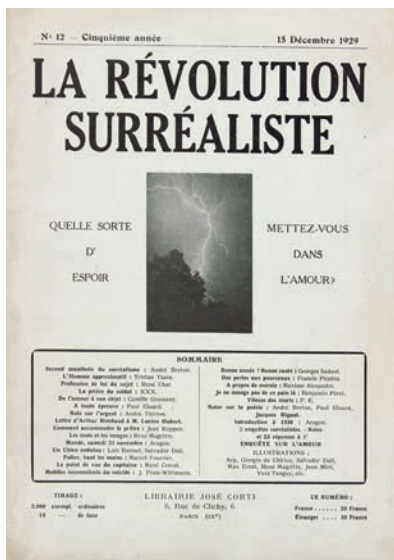
La Révolution surréaliste, Nr. 12, 15. Dezember 1929, Titelseite

Werk wurde ein neues Kapitel in seinem Schaffen aufgeschlagen, wo er jedem Bild die Lösung eines „Problems“ zuwies: So „glichen meine Untersuchungen dem Aufspüren der Lösung von Problemen, für die ich drei bekannte Größen hatte: den Gegenstand, das ihm im Dunkel meines Bewußtseins anhaftende Ding und das Licht, in das dieses Ding gelangen sollte“. 23