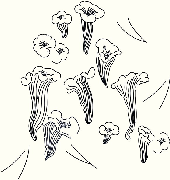
Totentrompete, Craterellus cornucopioides

ausschalten und in den »Pilzmodus« gehen und gegenwärtig sein – im Wald. Inzwischen habe ich gelesen, dass ein Ausflug in den Wald nicht nur Körper und Seele guttut, wie die Freiluftenthusiasten predigen, sondern auch dem Gehirn.