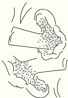
Semmelstoppelpilz, Hydnum repandum

Der Edel-Reizker, Lactarius deliciosus , und der Fichten-Reizker, Lactarius deterrimus , deren Milch gelb-rötlich ist, gehören ebenfalls zu den »Fünf Sicherem«. Mir wurde klar, dass die Welt der Pilze viel bunter war, als ich angenommen hatte. Obwohl viele Theorien darüber im Umlauf sind, weiß bisher niemand wirklich, weshalb die Pilze so viele Farben haben. Fest steht jedenfalls, dass es eine größere Artenvielfalt gibt