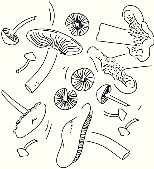
Eine Auswahl norwegischer Pilzarten

im Vergleich dazu nur 0,2 Prozent. Und gerade in den großen, artenreichen Gruppen gibt es viele unentdeckte.