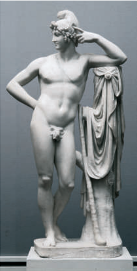
Antonio Canova, Statue des Paris, 1807–1816. Marmor, H. 205 cm (WAF B. 4)

Seine Wahl fiel auf Aphrodite, wofür er als Lohn Helena zur Gattin erhielt, was wiederum den Trojanischen Krieg nach sich zog. Canova zeigt Paris mit sprechend geöffnetem Mund, den Kopf in Denkerpose aufgestützt, den Blick abschätzend und deutlich seiner eigenen Schönheit bewußt hochmütig pointiert zu Seite gewandt, den Apfel hinter seinem Rücken verbergend.