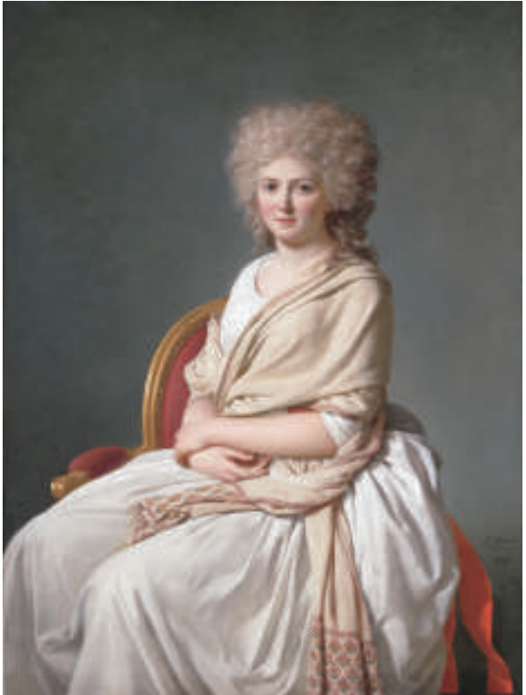
Jacques Louis David, Marquise de Sorcy de Thélusson , 1790. Lw. 129 x 97 cm (HuW 21)

ist, tritt die junge Frau dem Betrachter vor einer neutralen Wandfläche entgegen. Die unaufwendige Natürlichkeit der Kleidung findet ihre Entsprechung in den klaren Linien des strengen Arrangements, das auf alles Beiwerk zugunsten der jugendlichen Erscheinung der Porträtierten verzichtet. Die in helles Licht getauchte Gestalt wirkt nicht mehr durch die Raffinesse ihrer Pose, die Vielzahl ihrer Accessoires oder die Gewähltheit der Farben, sondern sie fesselt ganz unmittelbar durch die lakonische Eleganz ihrer kompakten, raumgreifenden Präsenz, die in der lichten Reinheit der Farben an die Klarheit antiker Skulpturen erinnert.