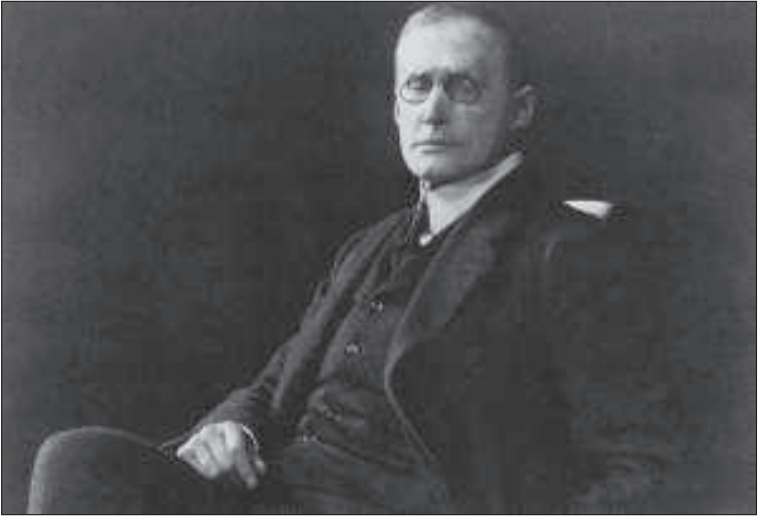
Hugo von Tschudi, Photographie um 1900