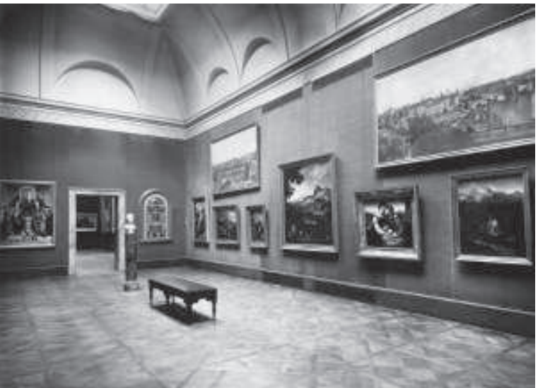
Romantiker- und Nazarenersaal der Neuen Pinakothek, historische Aufnahme von 1933