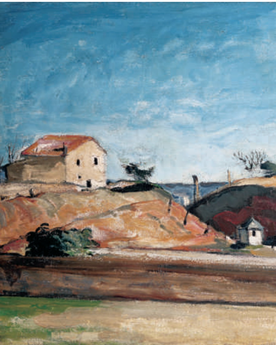
Paul Cézanne, Der Bahndurchstich, um 1870. Lw. 80 x 129 cm (8646)