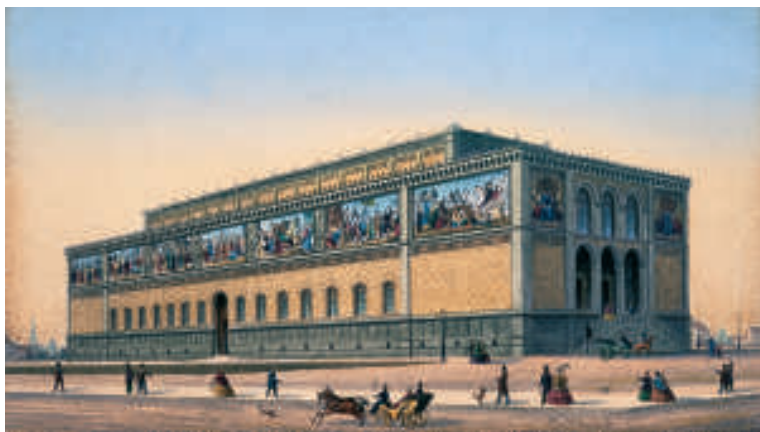
Neue Pinakothek in München, um 1865, Ansicht von Südosten. Aus einer Serie von 18 Ansichten von München im Verlag von Max Ravizza. Lithographie, farbige Kreide, Münchner Stadtmuseum, Inv.-Nr. Z (A7) 1115

aus der klassischen Landschaft Italiens und aus Werken Raffaels und seiner Vorläufer bezogen, eng verbunden. Nur so ist es zu erklären, daß die Neue Pinakothek über so viele bedeutende Bilder dieses Malerkreises verfügt, ganz abgesehen von dem einmaligen Bestand an Rottmann-Landschaften, die größtenteils als monumentale Wandbilder historischer Gegenden Italiens und Griechenlands ausgeführt sind.