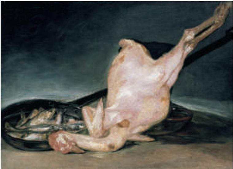
Francisco José de Goya y Lucientes, Gerupfte Pute , 1810/23. Lw. 44,8 x 62,4 cm (8575)

Goyas Gerupfte Pute ist eine ungewöhnliche Ausformung des aus holländischer wie auch aus spanischer Tradition geläufigen Küchenstilllebens. Anders als diese ästhetischen, der Vielfalt unterschiedlicher Oberflächenreize huldigenden Zusammenstellungen alltäglicher oder auch luxuriöser Dinge, ist der Vogel hier in ebenso künstlichem wie labilem Arrangement ungeachtet seiner Steifheit brutal diagonal über das Bildformat gestreckt, gestützt von einer Sardinienpfanne. Dabei wird er in seiner wächsernen Nacktheit so unvermittelt von dem grellen, künstlichen Bildlicht erfaßt und vor dem diffusen Bildgrund zur Schau gestellt, daß er zur verstörenden, zeichenhaften Ausdrucksform der leidenden, ja gefolterten Kreatur wird.