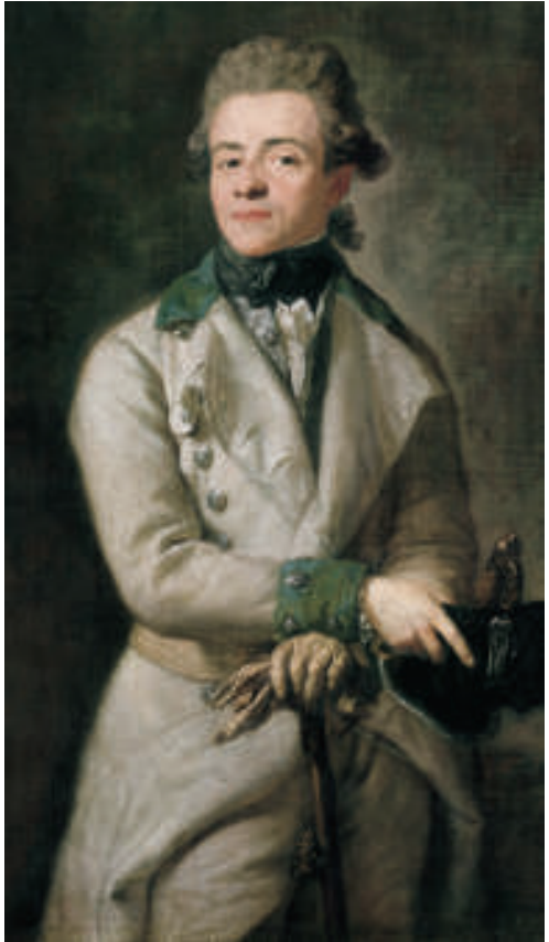
Anton Graff, Heinrich XIII. Graf Reuss ä.L., 1775. Lw. 112, 6 x 84 cm (9954)

Ein Charakterporträt ist das Bildnis Heinrich XIII. Graf Reuss ä.L. von dem gebürtigen Schweizer Anton Graff (1736 Winterthur – 1813 Dresden), der ab 1789 als Professor der Porträtmalerei in Dresden lehrte. Die Darstellung des jungen Mannes konzentriert sich auf den abschätzenden Blick seiner forschenden Augen, die den Betrachter zu verfolgen scheinen, und die skeptische Neugier seines Gesichtsausdrucks. Die leger offenstehende Jacke der Uniform eines Staboffiziers des österreichischen Infanterieregiments wirkt demgegenüber als nebensächliches Kleidungsstück und die gepuderte Rokoko-