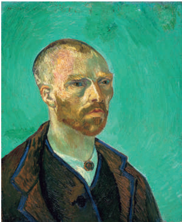
Vincent van Gogh, Selbstbildnis, 1888. Lw. 62 x 52 cm. Cambridge (MA), Fogg Art Museum, Harvard University Art Museums, Bequest of Collection of Maurice Wertheim