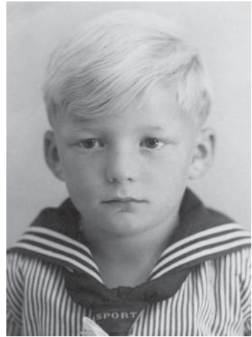
Ein Bremer Leichtmatrose in jungen Jahren.

konnte: Unter der Woche gab es meistens Eintopf, tagelang aus demselben Kessel, immer wieder aufgewärmt. Freitags machte sich meine Mutter mit mir auf den Weg zu den Bremer Stadtwerken, um Vaters Lohntüte abzuholen. Mit diesem Geld ging sie dann von Laden zu Laden, um Reste einzukaufen: Wurstzipfel, Kuchenränder, all das, was die »besseren« Leute verschmähten. Aber wenn wir an den Wochenenden Wurst aufs Brot bekamen, war das für uns ein gehöriges Festessen. Erst als ich deutlich älter war, gab es hin und wieder sogar mal ein Kotelett.