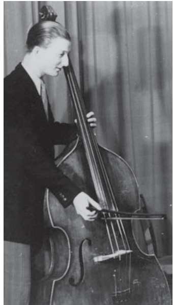
Zur Schonung der Fingerkuppen: streichen statt zupfen.

Der Unterricht war sehr trocken, kein Vergleich zu den Tagen bei meinem alten Meister Wellen. Ständig bekamen wir neue Noten