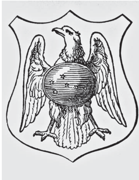
Abb. 5. Familienwappen Richard Wagners, das er nach 1865 für den Privatdruck seiner Autobiografie Mein Leben entwarf. Durch die Kombination des Geiers mit dem Sternbild des Großen Wagens vereinigte er symbolisch den Vater Wagner mit dem Stiefvater Geyer und stiftete dadurch Jahrzehntelange Verwirrung über die Frage, wer von beiden sein leiblicher Vater sei.

Jahre nach dem Tode des Stiefvaters, sich wieder nach Leipzig wandte, nahm ich dort, am Sitz meiner ursprünglichen Verwandtschaft den Namen Wagner wieder an« ( ML , S. 11). Der Geyer aber verließ ihn nicht; Jahrzehnte später wählt er einen Geier zum Familienwappen, das, verbunden mit dem Sternbild des Großen Wagens, die ab 1870 erscheinende (private) Erstausgabe von Mein Leben zierte.