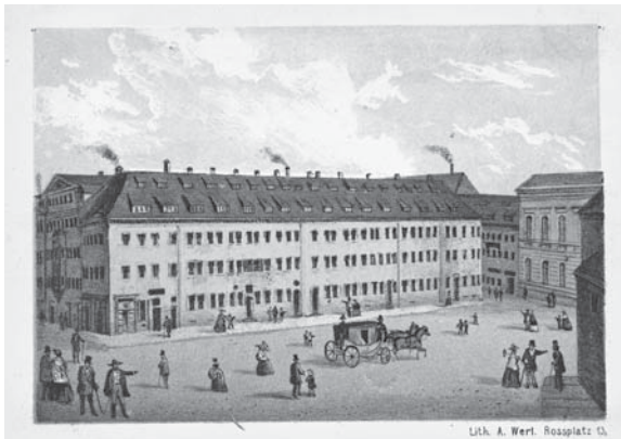
Abb. 3. Die Nicolaischule in Leipzig. Lithografie von A. Werl