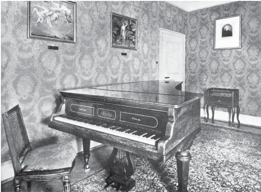
Abb. 2. Richard Wagners Erard-Flügel in Tribschen.