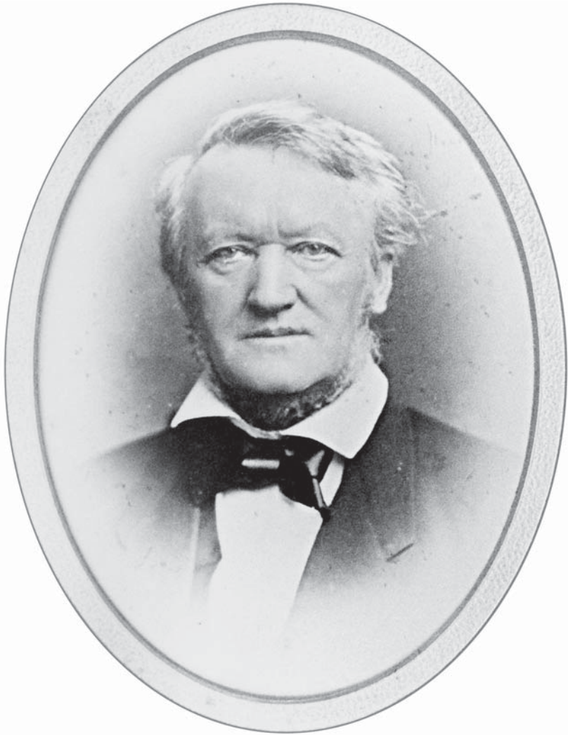
Abb. 1. Porträtfoto des Studios Elliott and Fry, London 1877