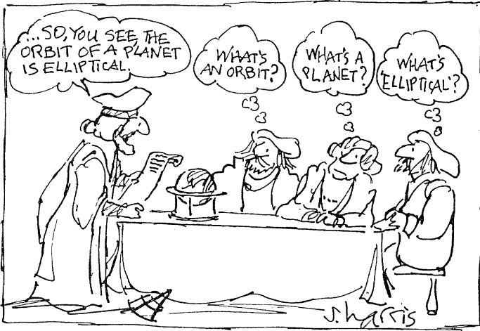
Johannes Keplers »Uphill battle«.

Umgang haben und mit denen wir uns erst vertraut machen müssen.