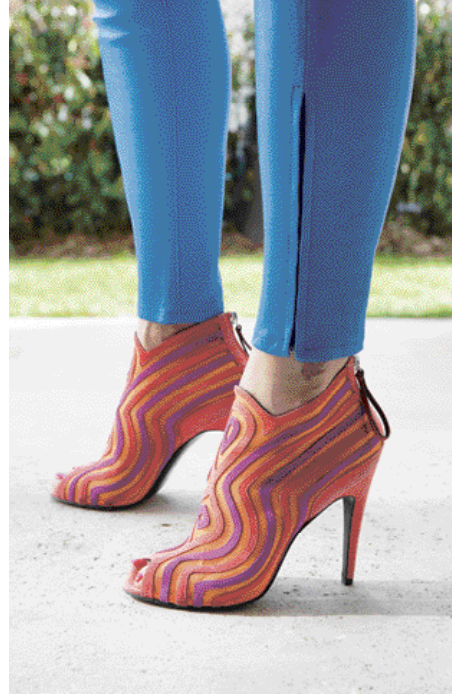
Low Boots von Pierre Hardy

Als die Absatzschuhe Ende des 19. Jahrhunderts wieder in Mode kommen, werden sie nur noch von Frauen getragen. Die Absatzhöhe bleibt »feinbürgerlich«, bis es der technische Fortschritt erlaubt, sie höher und wagemutiger zu machen. Der französische Schuhdesigner Charles Jourdan machte den Absatz schließlich schma-