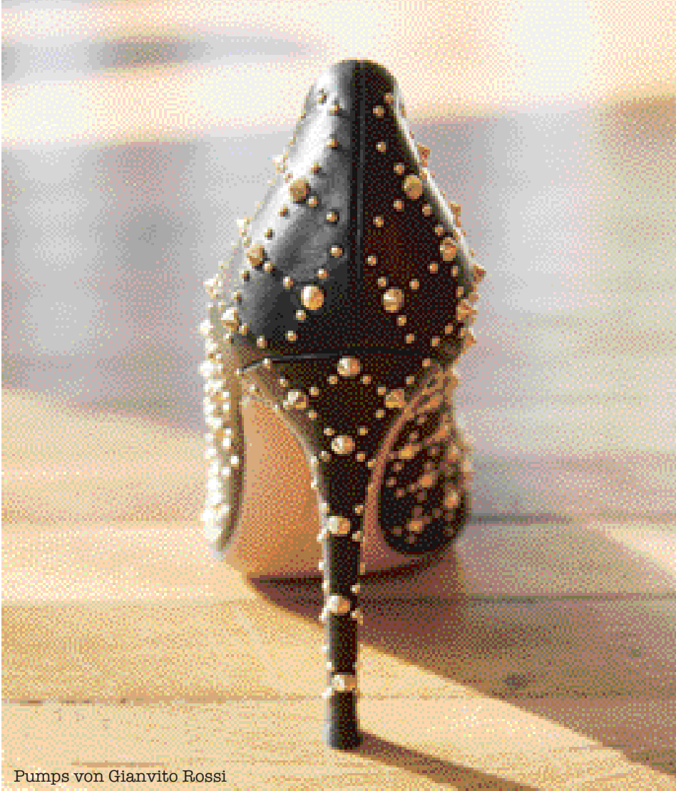
Pumps von Gianvito Rossi