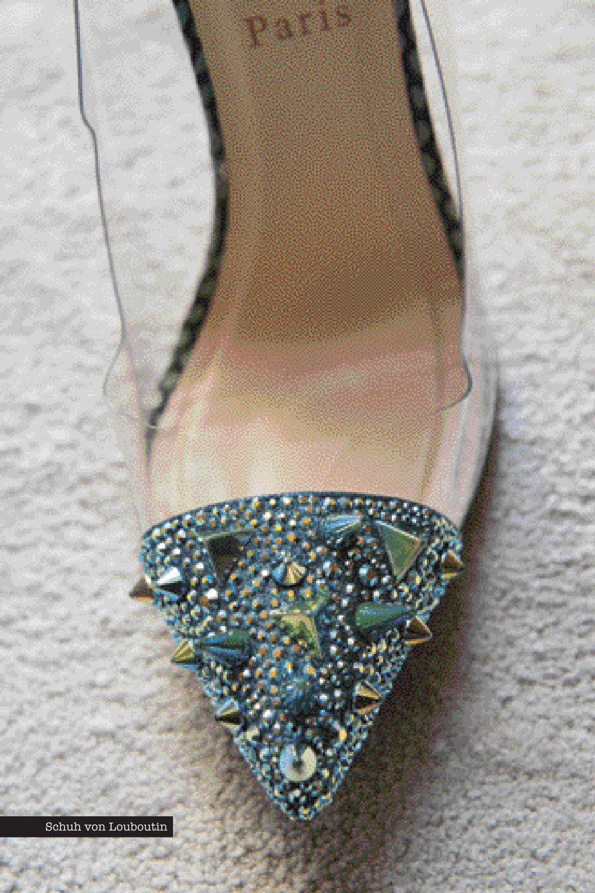
Schuh von Louboutin