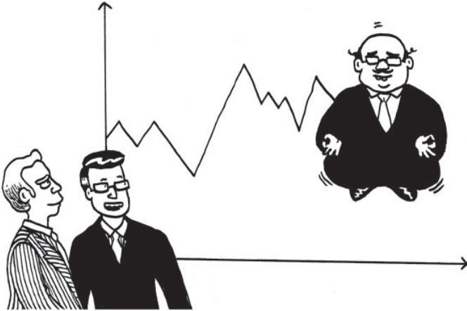
»Wir verfolgen hier den Tao-Jones-Index.«

dieses und anderer Programme zur Persönlichkeitsentwicklung zu kümmern. Ich finde es amüsant, dass Google es einem Ingenieur gestattet, Unterricht in emotionaler Intelligenz zu geben. Was für ein Unternehmen!