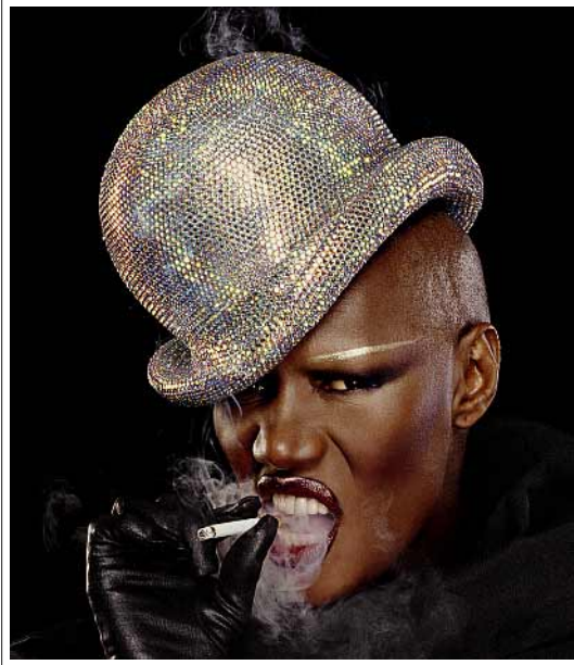
Grace Jones für V Magazine, 2009

» Ich habe alles in meiner Macht Stehende daran gesetzt, Grace und ihre Karriere zu retten. «