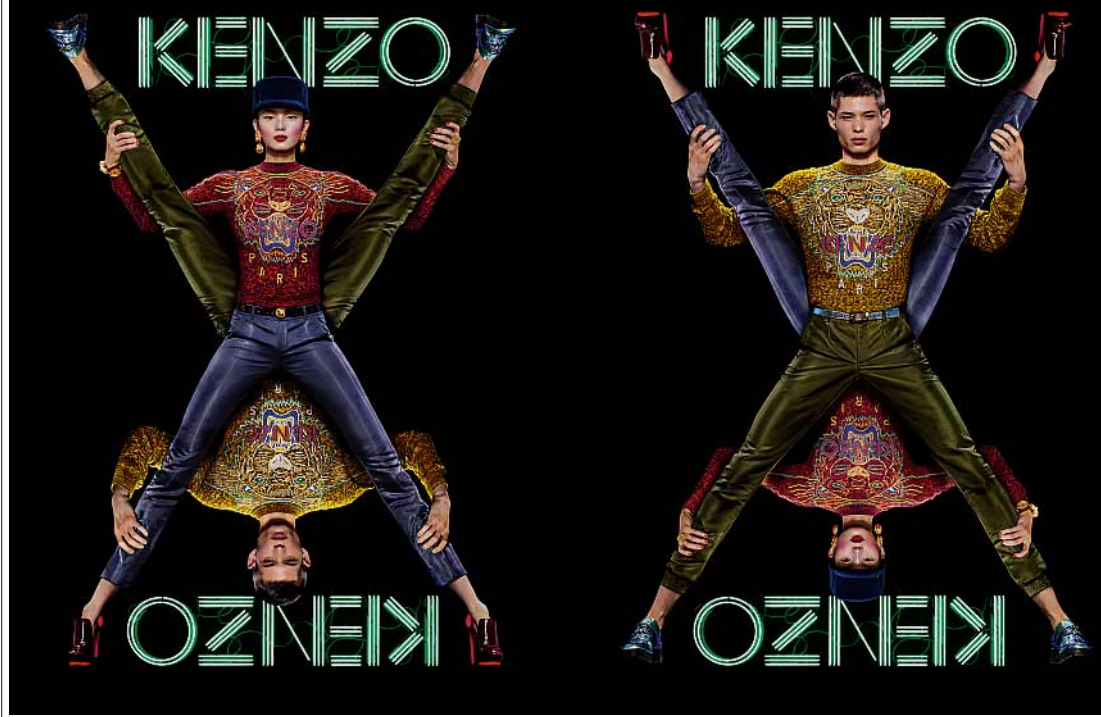
Die erste X-Kampagne für Kenzo, Herbst/Winter 2012–13

stoff: Japan, Korea, China, die Probleme zwischen den Ländern, Hip-Hop, Kung-Fu, Mangas ... sehr interessant!