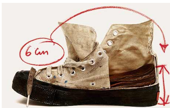
Basketballschuh aus der Serie French Correction, 1970

Schön für sie. Meine French Correction war sowieso nie dazu gedacht, kommerzialisiert zu werden. Möglicherweise ist Isabel Marant der Modeprofi, auf den wir alle gewartet haben?