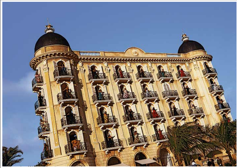
Égoïste, Filmset, Rio de Janeiro, 1990

Irrungen und Wirrungen eines Charakters namens Goudemalion, von seiner Kindheit bis heute. Saint-Mandé, Cowboys, Indianer, afrikanische Krieger, Tiger, die French Correction , Toukie, Grace, Farida, HRH the Queen of Seoul – alle waren dabei. Die Ausstellung war ein großer Erfolg. Ich habe wirklich Glück!