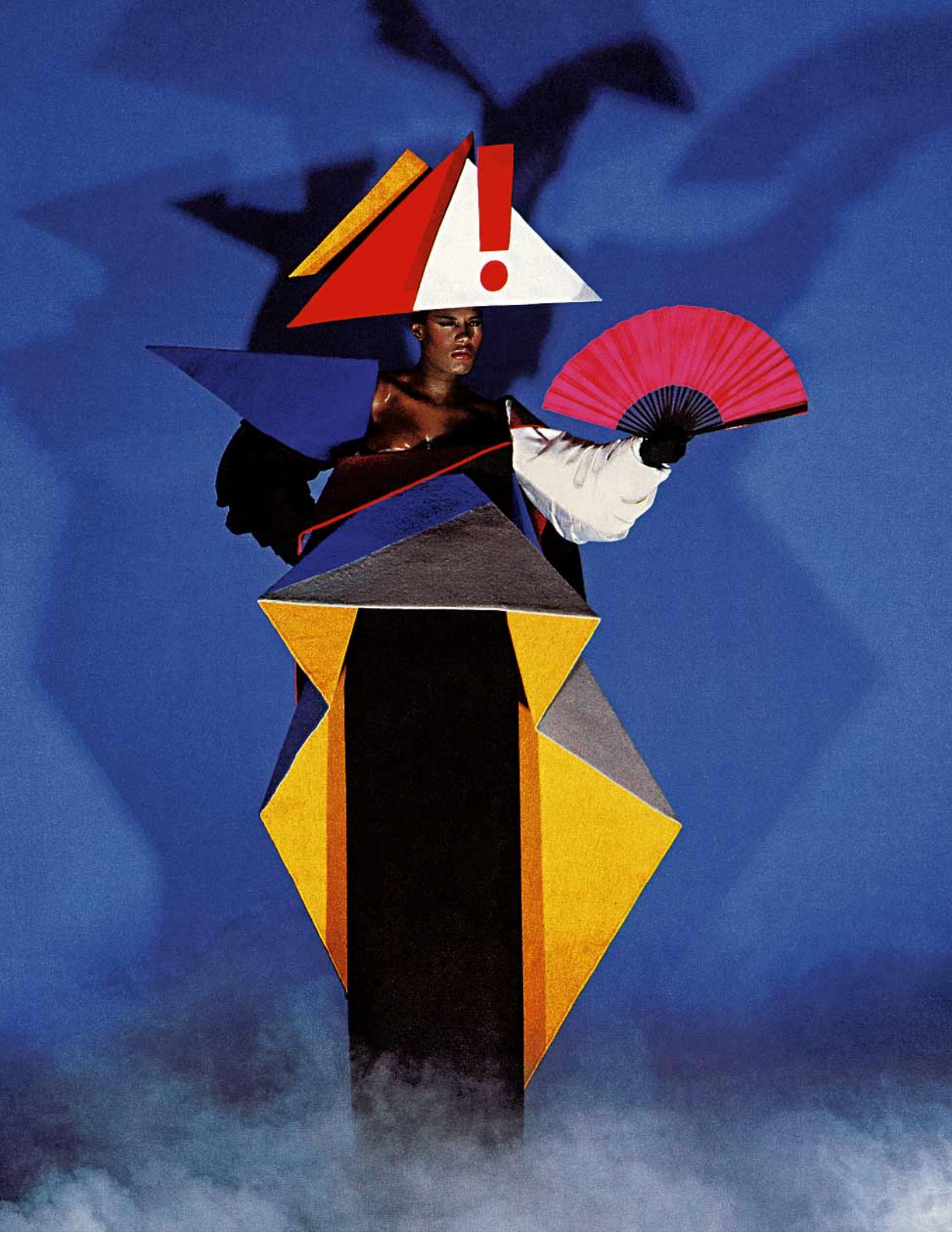
Konstruktivistisches Umstandskleid für Grace Jones, 1979