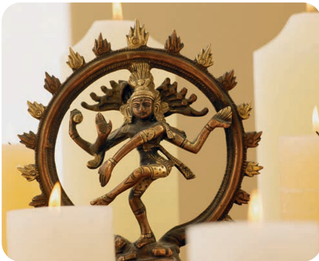
Das Tantra-Massageritual führt zu einem bewussten, meditativen Umgang mit der Lust.