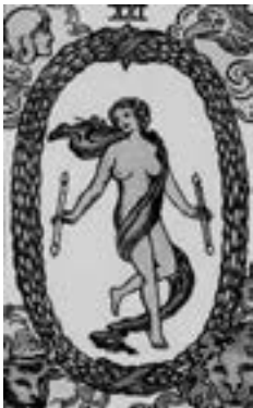
»Die Welt« aus dem Waite-Tarot

Mit großem Abstand am verbreitetsten ist das Waite-Tarot , auch als Rider-Tarot oder Rider-Waite-Tarot bekannt. Es wurde von Arthur E. Waite und Pamela Colman Smith