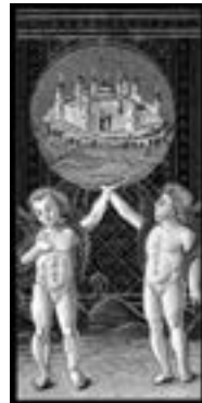
»Die Welt« aus dem Visconti-Tarot, dem ältesten Tarot

Die ersten Tarot-Karten entstanden in der Renaissance-Zeit. Zwischen 1430 und 1460 wurden sie in Mailand und Bologna für große Fürstenhäuser gemalt. Die Renaissance-Zeit war ein »Schmelztiegel«, die Menschen wollten »raus aus dem finsternen Mittelalter«, sie suchten nach neuen Wegen, für die sie unzählige antike Traditionen wiederbelebten und neu entdeckten. Dieser »Zeitgeist« der Renaissance spiegelt sich in der Motivwahl des Tarot wieder. Die 78 Karten versammeln eine Fülle von typischen