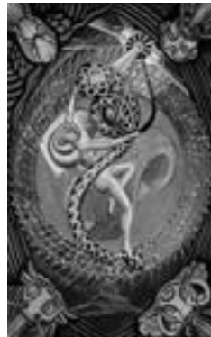
»Das Universum« aus dem Crowley-Tarot

Das Crowley-Tarot zeichnet sich durch seine energiegeladene Darstellungsweise aus und besitzt im Übrigen eine allegorische, d. h. sinnbildhafte Symbolik, die in sich lebt und zu einer persönlichen Betrachtungsweise auffordert. Sein beson-