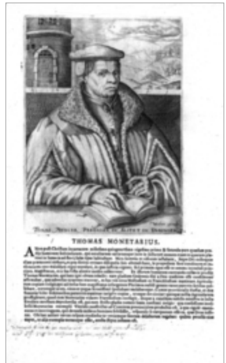
Abb. 1: Thomas Müntzer, Kupferstich von Christoffel van Sichem (1609)

In vielen Städten opponierten Bürger gegen patrizische Räte, und am Oberrhein und im Elsass verschworen sich