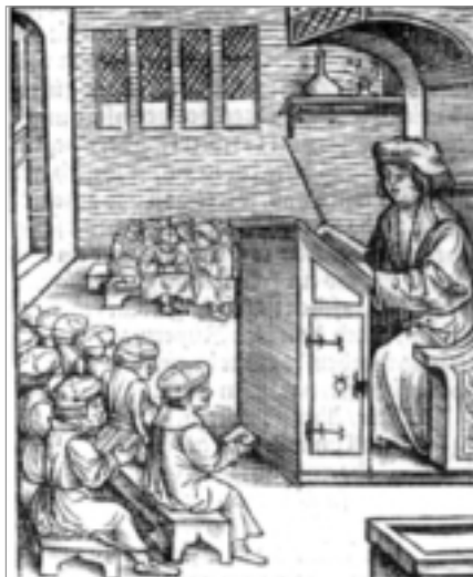
Abb. 5: Unterricht in einer Schule (1524)