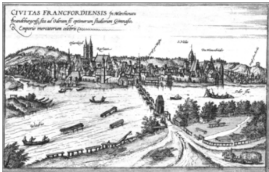
Abb. 8: Ansicht der Stadt Frankfurt an der Oder (1572)

Am Beginn des 16. Jahrhunderts beherbergte die Stadt nach Schätzungen etwa 5.500 Einwohner. An einem Oderübergang entstanden, war der Kaufmannssiedlung 1253 das Stadtrecht verliehen worden. Seit 1355 sind Jahrmärkte nachgewiesen, und seit 1386 war sie Mitglied der Hanse. Den Rat besetzten hauptsächlich Kaufleute und Tuchhändler. Wie in Leipzig lebte auch hier ein großer Teil der Bürger vom Handel. 141 Die günstige Lage an mehreren