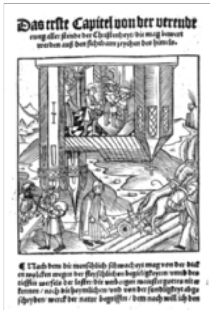
Abb. 2: Veränderung aller Stände: Bauer am Altar und Priester beim Pflügen, Holzschnitt (1522)