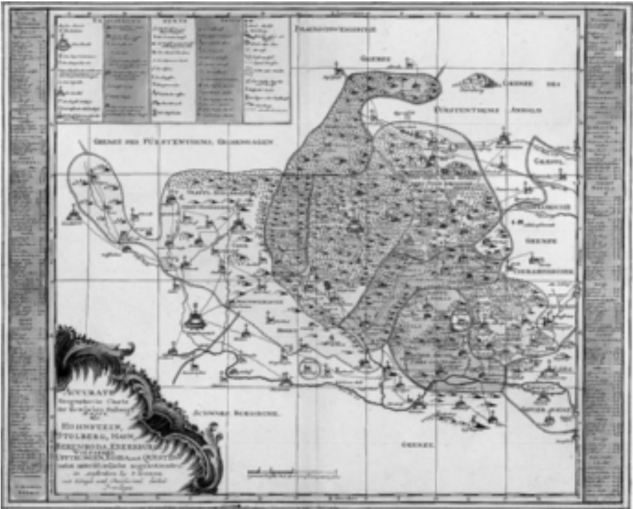
Abb. 3: Karte der Grafschaft Stolberg (1757)

Die Territorien der Harzgrafen waren zwar relativ klein, aber durch verwandtschaftliche Beziehungen verbunden. Das hatte die Ausbildung eines Gemeinschaftsbewusstseins zur Folge, führte aber immer wieder zu Erbstreitigkeiten. Die politischen Verhältnisse waren folglich nicht stabil und konnten sich durch territoriale Verluste oder Gewinne rasch ändern. Vor allem waren die Harzgrafen gezwungen, sich in der größeren politischen Arena zu behaupten. Herausgefordert wurden sie von den benachbarten mächtigen Dynastien, den sächsischen Wettinern und den braun-