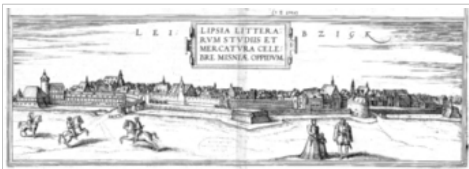
Abb. 6: Ansicht der Stadt Leipzig (1572)

Das Spektrum der Druckproduktion reichte von den Schriften antiker Autoren bis zu humanistischer Literatur. Zum großen Teil wurden sie von der Universität in Auftrag gegeben, weil sie für das Studium benötigt wurden. Das gilt zum Beispiel für Lehrbücher über Logik und Grammatik. Auch wurden neben theoretischen Schriften über Mathematik Rechenbücher für Kaufleute gedruckt, neben astronomischen Schriften Kalender und Prognostiken und neben theologischer Literatur liturgische Werke.