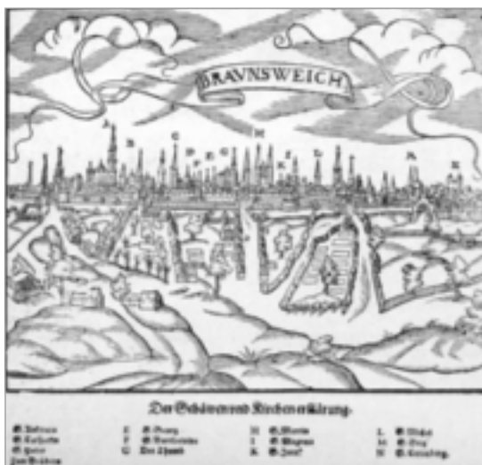
Abb. 10: Ansicht von Braunschweig (1628)

Braunschweig zählte fünf Weichbilde (den Stadtvierteln vergleichbar), von denen jedes ein Rathaus, einen Rat und eine Pfarrkirche besaß: Altstadt, Altewiek, Hagen, Neustadt und Sack, die unterschiedliche soziale Strukturen aufwiesen. Die fünf Räte bildeten den für die Kommune verantwortlichen Gesamtrat, in dem vor allem Vertreter aus den Fernhändler- und Handwerker gilden saßen. In kirchlicher Hinsicht waren – durch das Flüsschen Oker getrennt – zwei Bistümer zuständig: Hildesheim für die Altstadt, Neustadt und Sack, und Halberstadt für Altewiek und Hagen.