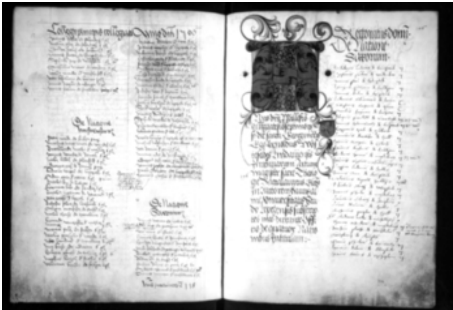
Abb. 7: Eintragung Müntzers in der Matrikel der Universität Leipzig von 1506

Die Matrikel vermerkt außerdem, dass Müntzer sechs Groschen Studiengebühr entrichtete. Er wurde nicht als »pauper«, als arm ausgewiesen, wie es vielen anderen Studenten widerfuhr. Er zahlte aber nicht die volle Inskriptionsgebühr von zehn Groschen, die mit »totum« quittiert worden