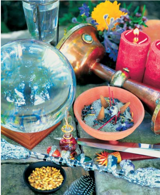
Die Zutaten für Rituale müssen sorgfältig gewählt werden.