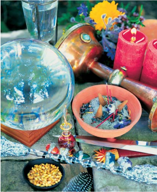
Die Zutaten für Rituale müssen sorgfältig gewählt werden.