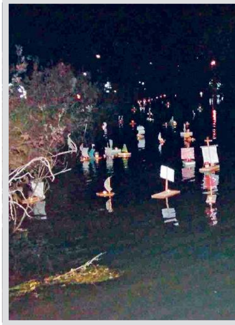
Allerseelenschiffchen in Schmidmühlen in der Oberpfalz.

versuchte man durch das Abhalten von Messen zu retten, durch Gebete und durch mancherlei abergläubische Praktiken. Brotkrumen warf man ins Ofenfeuer »für die Armen Seelen«, weil sie ja irgendwo in einem Feuer vermutet wurden. Wer beim Himbeeren- oder Brombeerenpflücken im Wald eine Beere fallenließ, der durfte nicht unter die Sträucher kriechen, um die verlorene Beere wieder aufzusammeln.