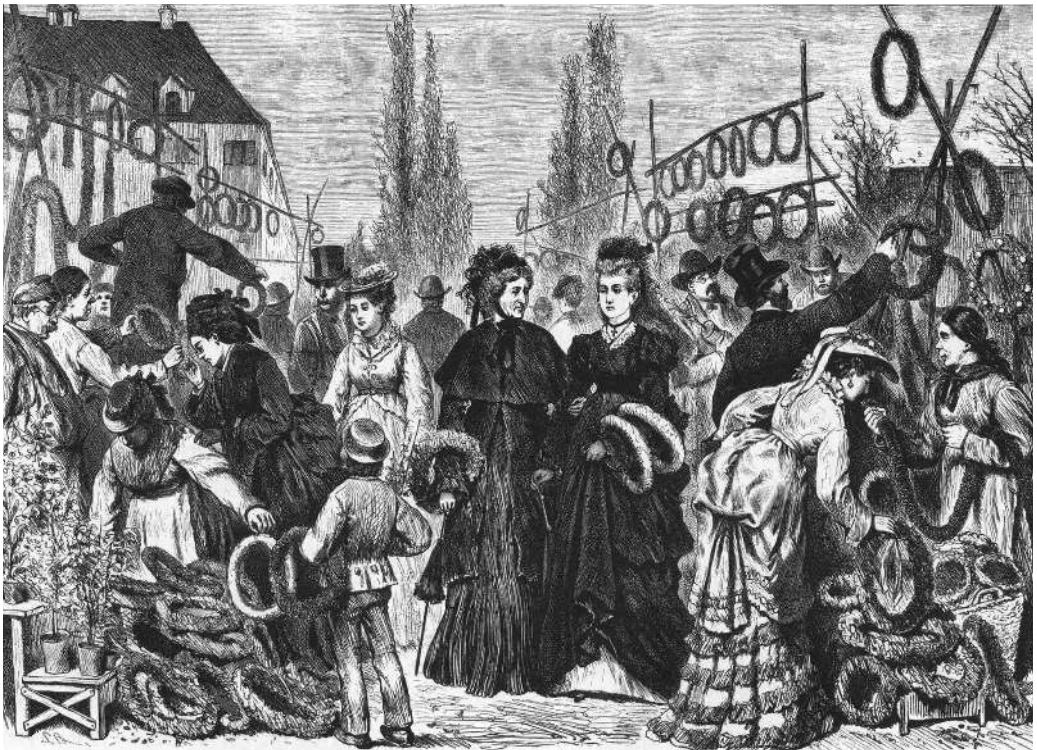
Der Kranzmarkt in München am Allerseelentag, Grafik von 1874.

zwar nicht nur in der offiziellen Liturgie, sondern auch im Brauchtum. An Allerheiligen und Allerseelen, hieß es, dürfen die Verstorbenen für 24 Stunden an den Ort ihres irdischen Lebens zurückkehren. Diese 24 Stunden begannen am Vorabend – oder sogar noch früher. Denn man erzählte sich, die »Armen Seelen« freuten sich so sehr auf ihren Ausflug, dass sie sich schon Tage vorher auf den Weg machten. Die Geisterzeit um den Novemberbeginn war also nicht so genau fassbar. Ebensovienig konnte man sich vorstellen, in welcher Form die Armen Seelen auftauchen würden. Man vermutete unsichtbare Geistwesen, glaubte sie als tanzende Lichter im Nebel überm Moor auszumachen oder auch in der Gestalt von im Verborgenen lebenden Tieren wie Fröschen, Kröten oder Maulwürfen. Aber