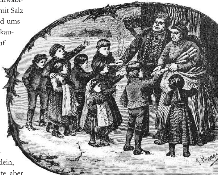
Die Bäuerin verteilt Seelenwecken, Grafik von 1885.

Man unterschied nämlich klar zwischen den süßen Seelwecken oder -zöpfen für die Patenkinder, Godelwecken hießen sie auch, und den sogenannten Spendwecken aus einfachem Brotteig. An Allerseelen zogen die »Seelengänger« – Kinder und arme Familien – von Haus zu Haus und wurden von der Bäuerin mit Seelwecken beschenkt. Die Wissenschaft nennt dies einen Heischebrauch: Die Seelengänger wollen nämlich etwas erheischen – ebenso wie etwa die Klöpfler (Seite 98), die Sternsinger (Seite 176) oder auch die Kinder, die an Halloween an die Türen klopfen. »Wir bitten um an Zelten, der Herrgott wird's ver-