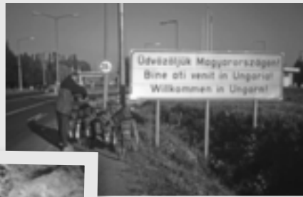
Wie gut, dass es auch auf Deutsch da steht!