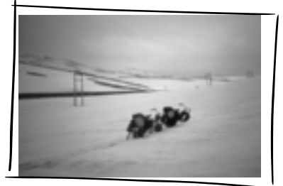
Hochsommer auf der Hardangervidda.