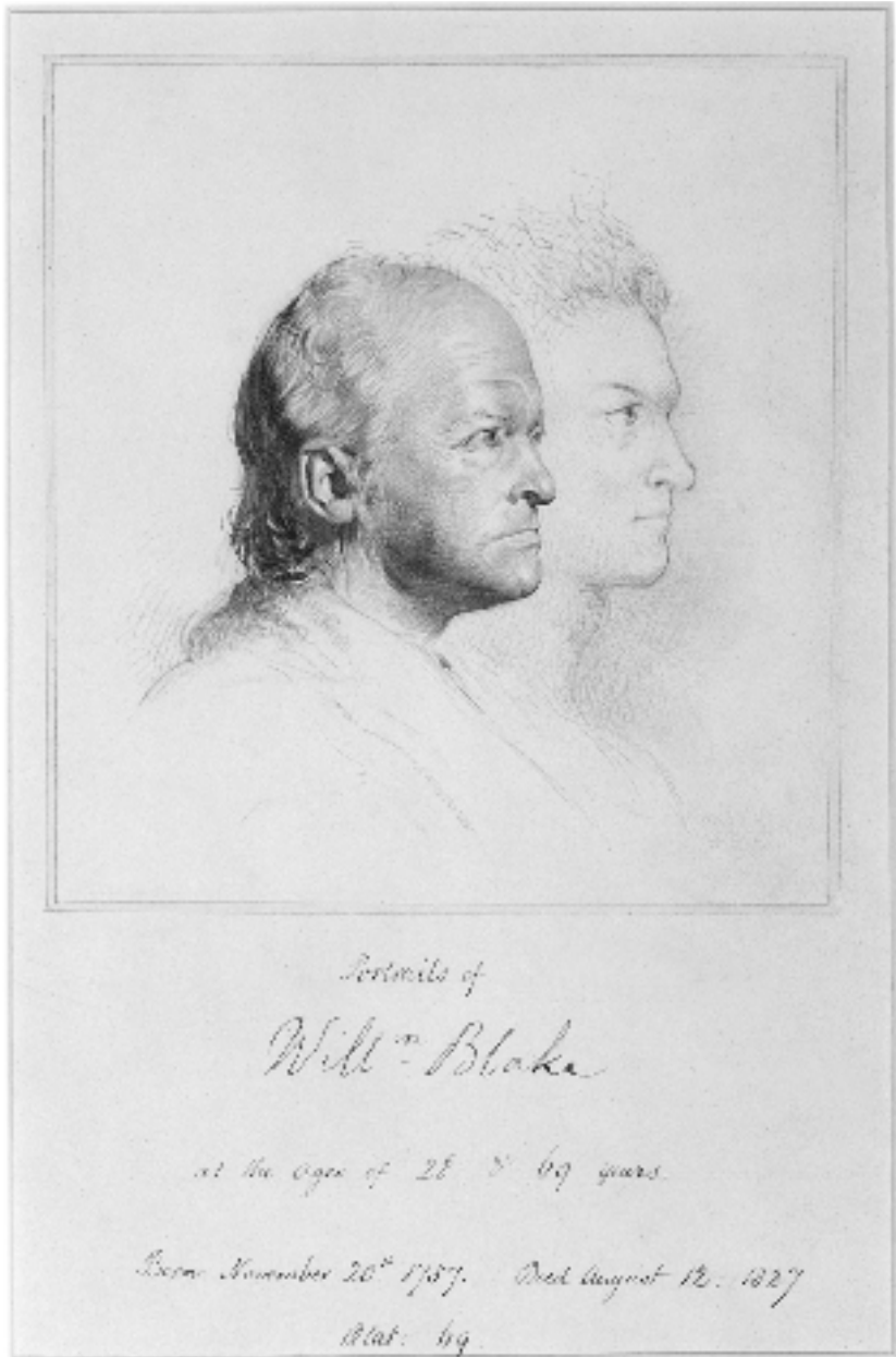
William Blake im Alter von 28 und 69 Jahren