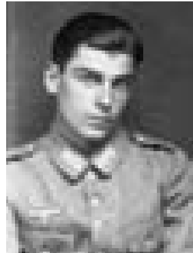
Zwischen Gefängnis und Front: vor dem Aufbruch nach Italien zur »Frontbewährung«, 1944.