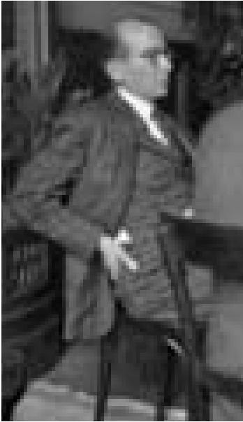
Mein Vater leitet in den späten dreissiger Jahren eine Sitzung.

ihren Amerikanern »Ausgang« erhalten, selbst meine Grossmutter war, obwohl inzwischen hoch in den Siebzigern, aus Lichterfelde nach Dahlem herübergewandert, ein Bus zwischen Dahlem und Lichterfelde fuhr schon lange nicht mehr. So feierte die ganze Familie die Heimkehr des Sohnes und den Umstand, dass alle das apokalyptische Ende des Krieges leidlich überstanden hatten.